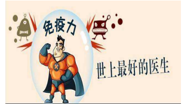
免疫力 世上最好的医生