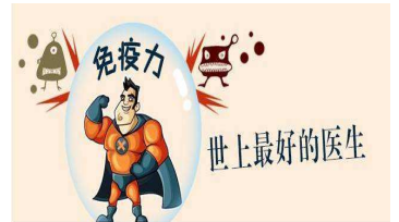
免疫力 世上最好的医生