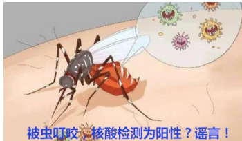
被虫叮咬，核酸检测为阳性？谣言！