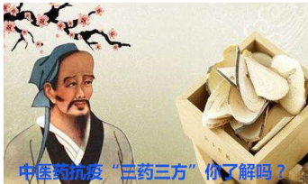
中医药抗疫“三药三方”你了解吗？