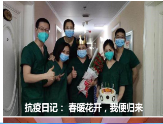
抗疫日记：春暖花开，我便归来