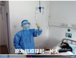
愿为抗疫撑起一片天