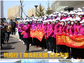
抗疫行 | 愿去时无惧 归来无恙