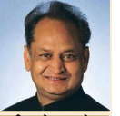
श्री अशोक गहलोत माननीय मुख्यमंत्री, राजस्थान