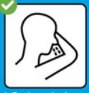
In Taschentuch oder Armbügel husten und niesen.