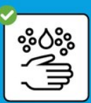
Gründlich Hände waschen.