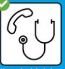
Nur nach telefonischer Anmeldung in Arztpraxis oder Notfallstation.