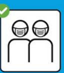
Empfehlung: Maske tragen, wenn Abstand halten nicht möglich ist.