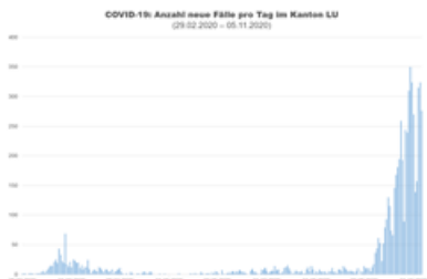
COVID-19: Anzahl neue Fälle pro Tag im Kanton Luzern

Neue Fälle pro Tag und kumulative Anzahl Fälle im Kanton Luzern, ersichtlich nach Alarmstufenkonzept