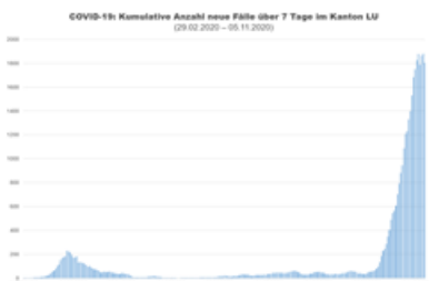
COVID-19: Kumulative Anzahl neue Fälle über 7 Tage im Kanton Luzern

Anzahl neue Fälle pro Tag im Kanton Luzern