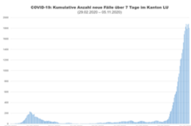
COVID-19: Kumulative Anzahl neue Fälle über 7 Tage im Kanton Luzern

Anzahl neue Fälle pro Tag im Kanton Luzern