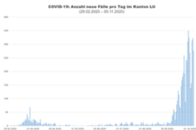
COVID-19: Anzahl neue Fälle pro Tag im Kanton Luzern

Neue Fälle pro Tag und kumulative Anzahl Fälle im Kanton Luzern, ersichtlich nach Alarmstufenkonzept