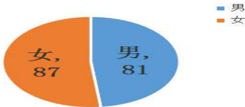
确诊病例性别分布（截至2月19日24时）