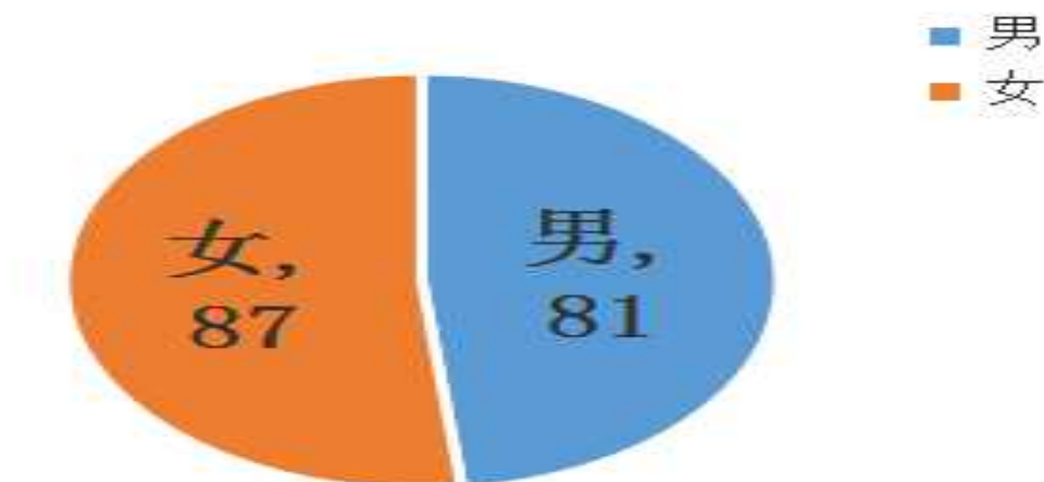
确诊病例性别分布（截至2月19日24时）