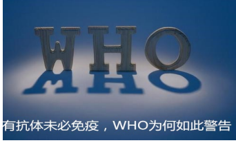
有抗体未必免疫，WHO为何如此警告