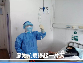
愿为抗疫撑起一片天