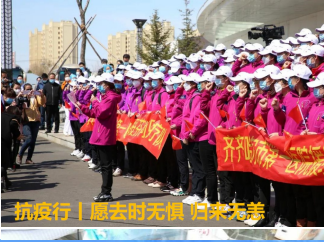
抗疫行 | 愿去时无惧 归来无恙