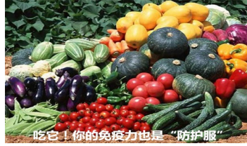
吃它！你的免疫力也是“防护服”