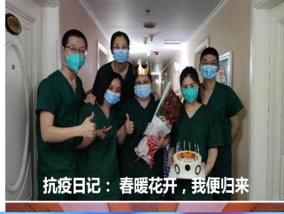
抗疫日记：春暖花开，我便归来