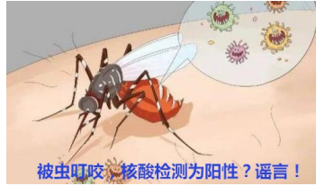
被虫叮咬，核酸检测为阳性？谣言！