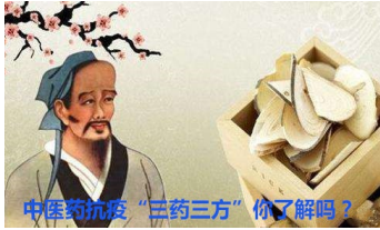
中医药抗疫“三药三方”你了解吗？