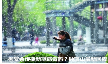
柳絮会传播新冠病毒吗？钟南山最新回应