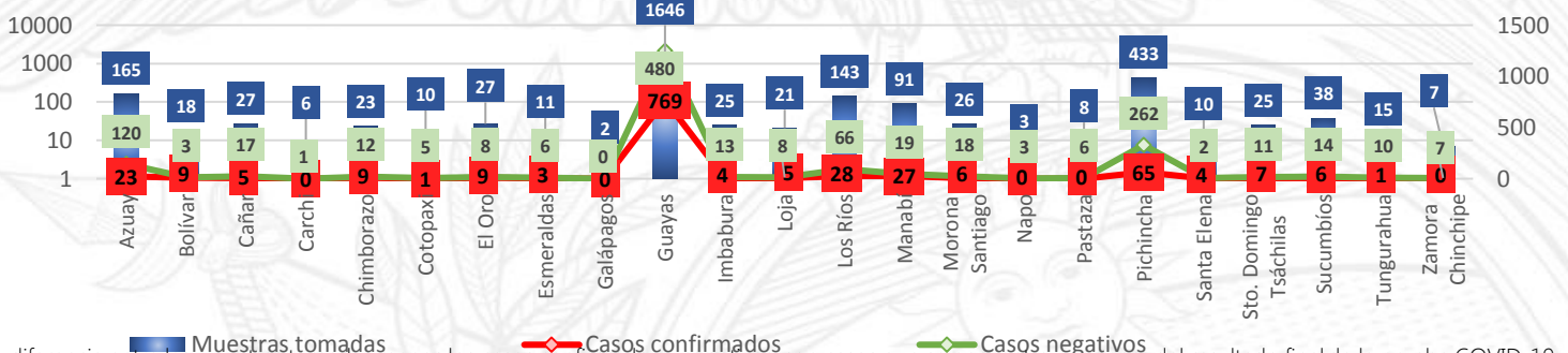
Número de muestras vs Casos Confirmados y Negativos

La diferencia entre las muestras tomadas menos los casos confirmados y negativos, son casos que se encuentran a espera del resultado final de la prueba COVID-19