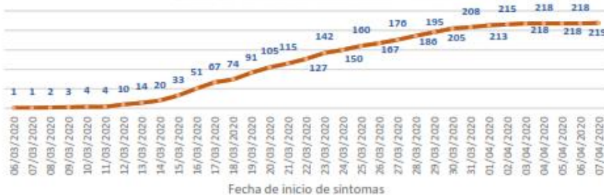
Línea de tendencia acumulada - MANABÍ