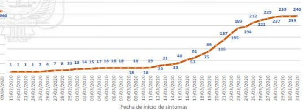
Línea de tendencia acumulada - LOS RÍOS