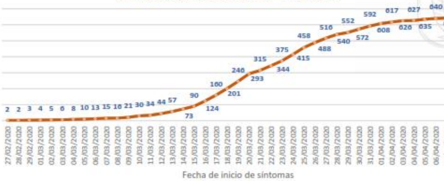
Línea de tendencia acumulada - PICHINCHA