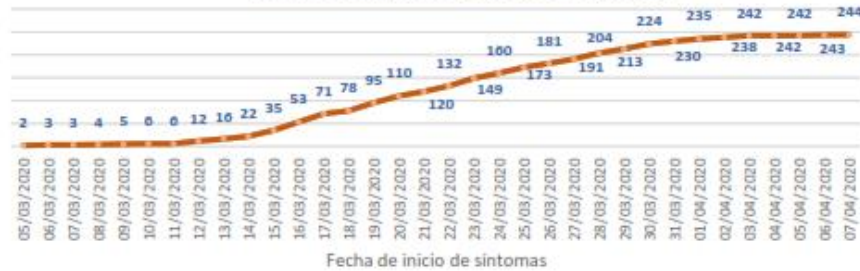
Línea de tendencia acumulada - MANABÍ