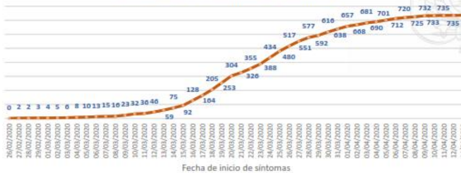
Línea de tendencia acumulada - PICHINCHA