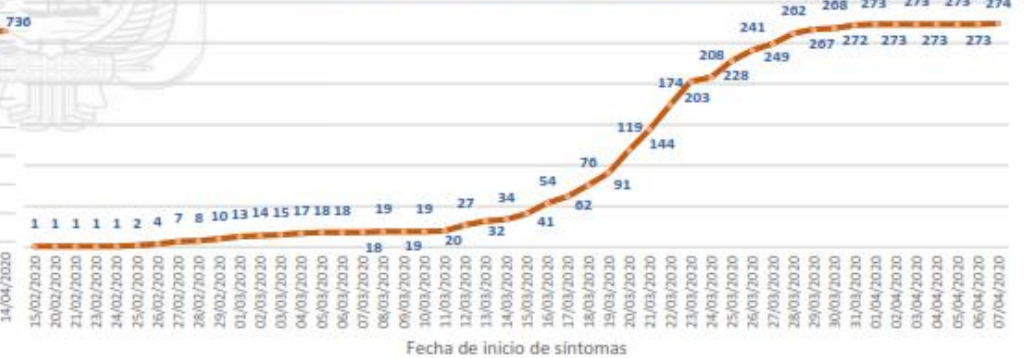
Línea de tendencia acumulada - LOS RÍOS