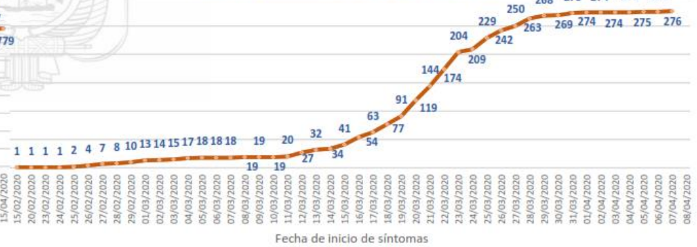
Línea de tendencia acumulada - LOS RÍOS