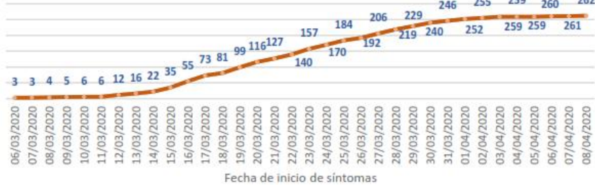
Línea de tendencia acumulada - MANABÍ