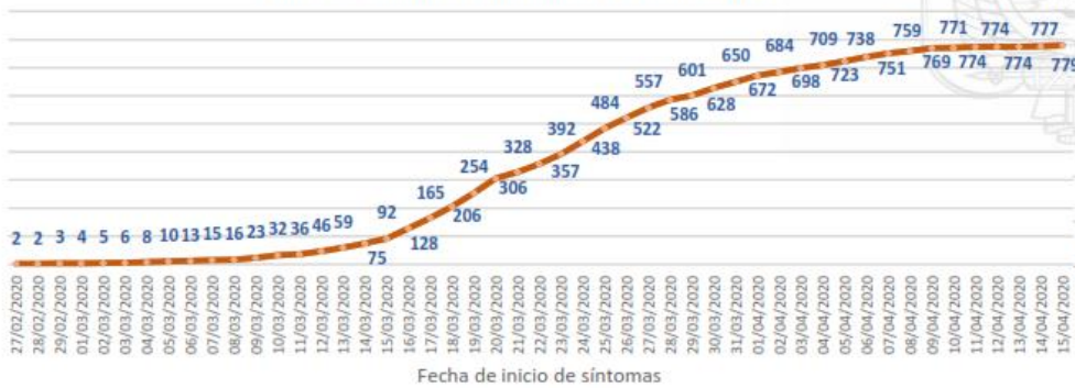
Línea de tendencia acumulada - PICHINCHA