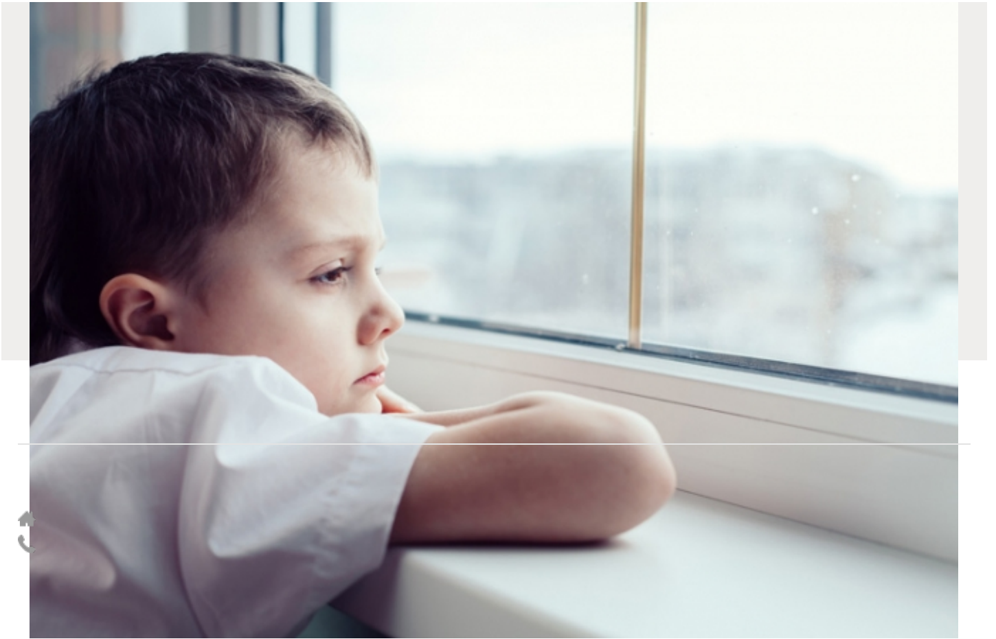
Plateforme de coordination et d'orientation TND