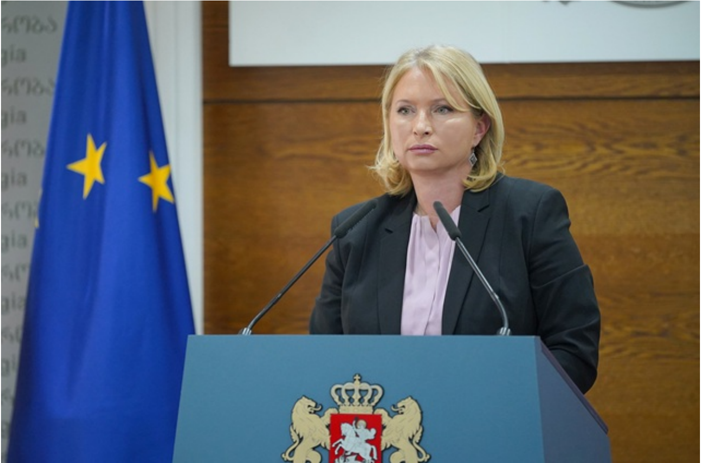
ნათია თურნავა - იტალიაში მყოფი საქართველოს მოქალაქეების ჩამოყვანას სახელმწიფო მოახდენს და ხარჯებსაც სახელმწიფო გაიღებს