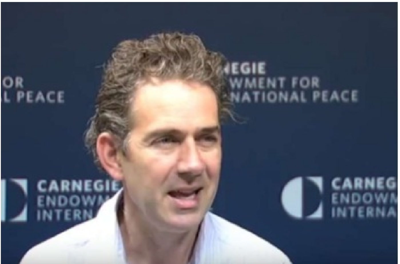
თომას დე ვალი საქართველოზე: ჯანდაცვის სფეროს პროფესიონალების დიდებული კოჰორტა - ჩვევები, რომლებიც დასავლელდება დაივიწყეს