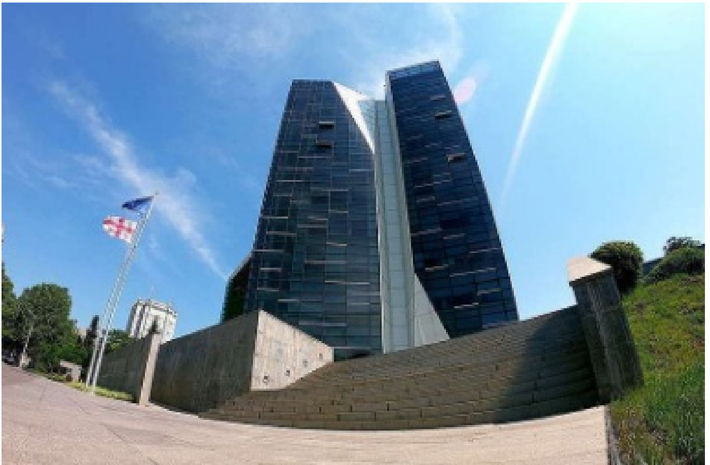
მონაცემთა გაცვლის სააგენტო მოქალაქეებს კიბერდანაშაულის რაოდენობის ზრდასთან დაკავშირებით რეკომენდაციებით მიმართავს