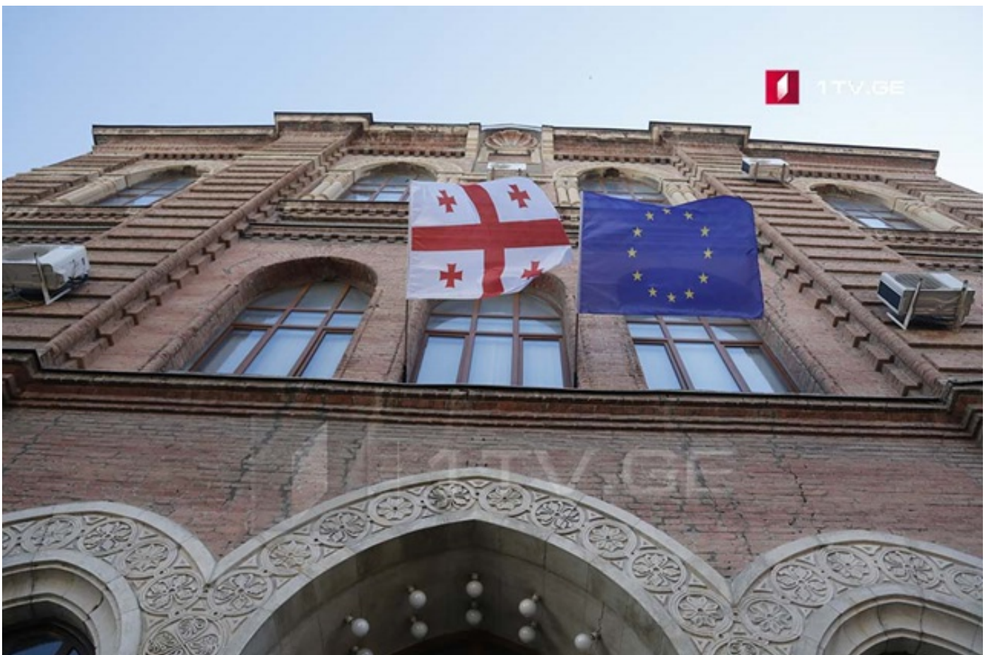
საგარეო უწყება კორონავირუსის პირობებში უცხოეთში მყოფი საქართველოს მოქალაქეების დახმარების შესახებ ინფორმაციას ყოველდღიურად გამოაქვეყნებს