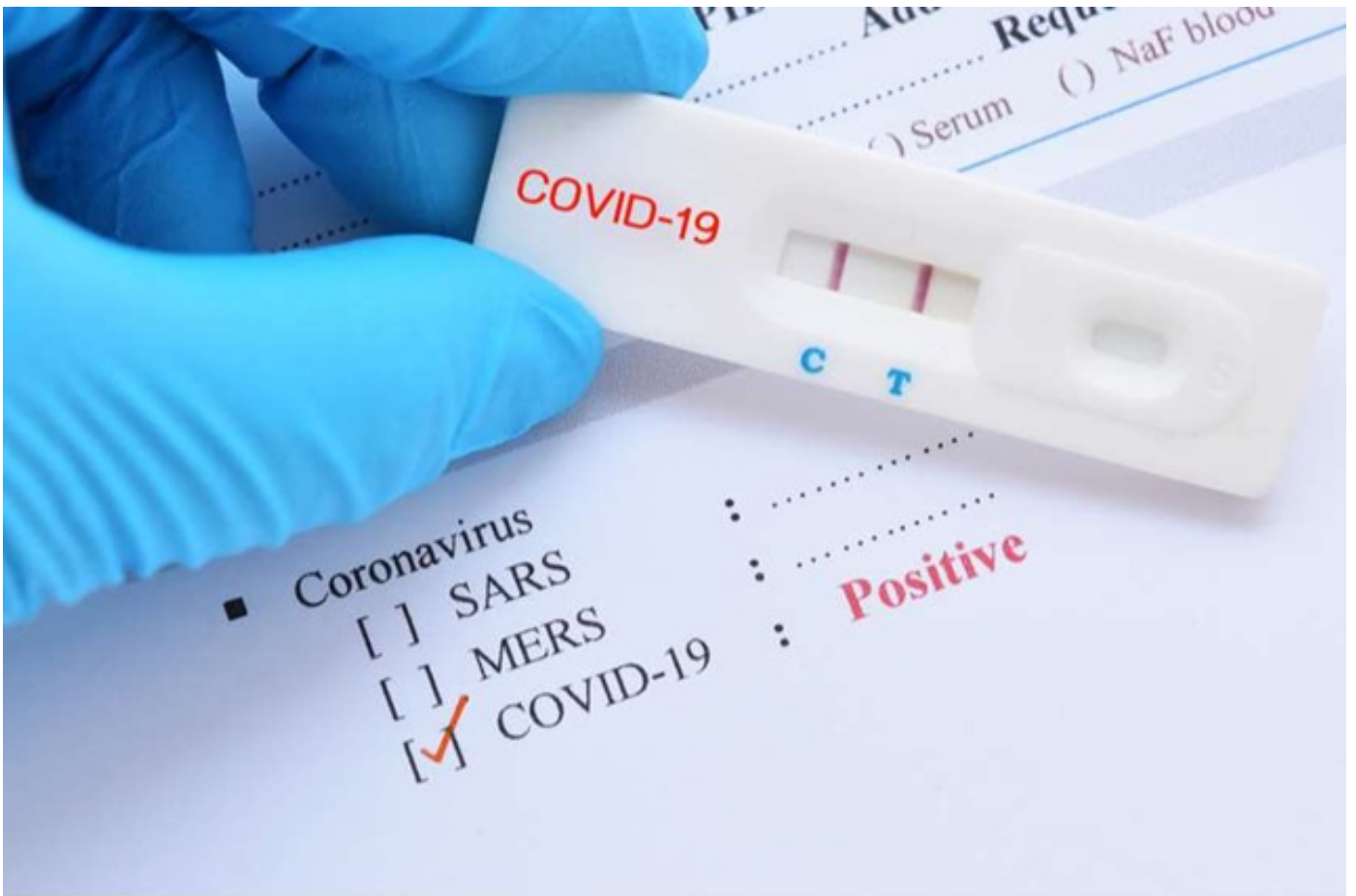
ჯანდაცვის სამინისტრომ დაამტკიცა იმ ჯგუფთა ჩამონათვალი, ვისაც აგრესიული ტესტირება ჩაუტარდება