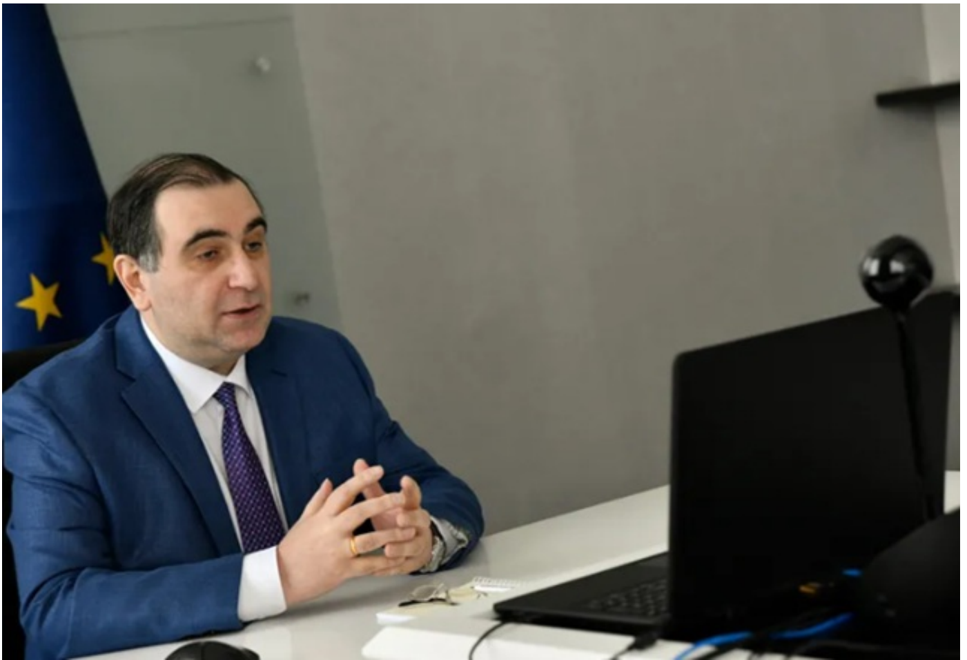
გაეროს ბავშვთა ფონდის წარმომადგენელმა COVID-19-ის წინააღმდეგ ბრძოლაში საქართველოს ხელისუფლების მიერ გადადგმულ მყისიერ ნაბიჯებს მაღალი შეფასება მისცა