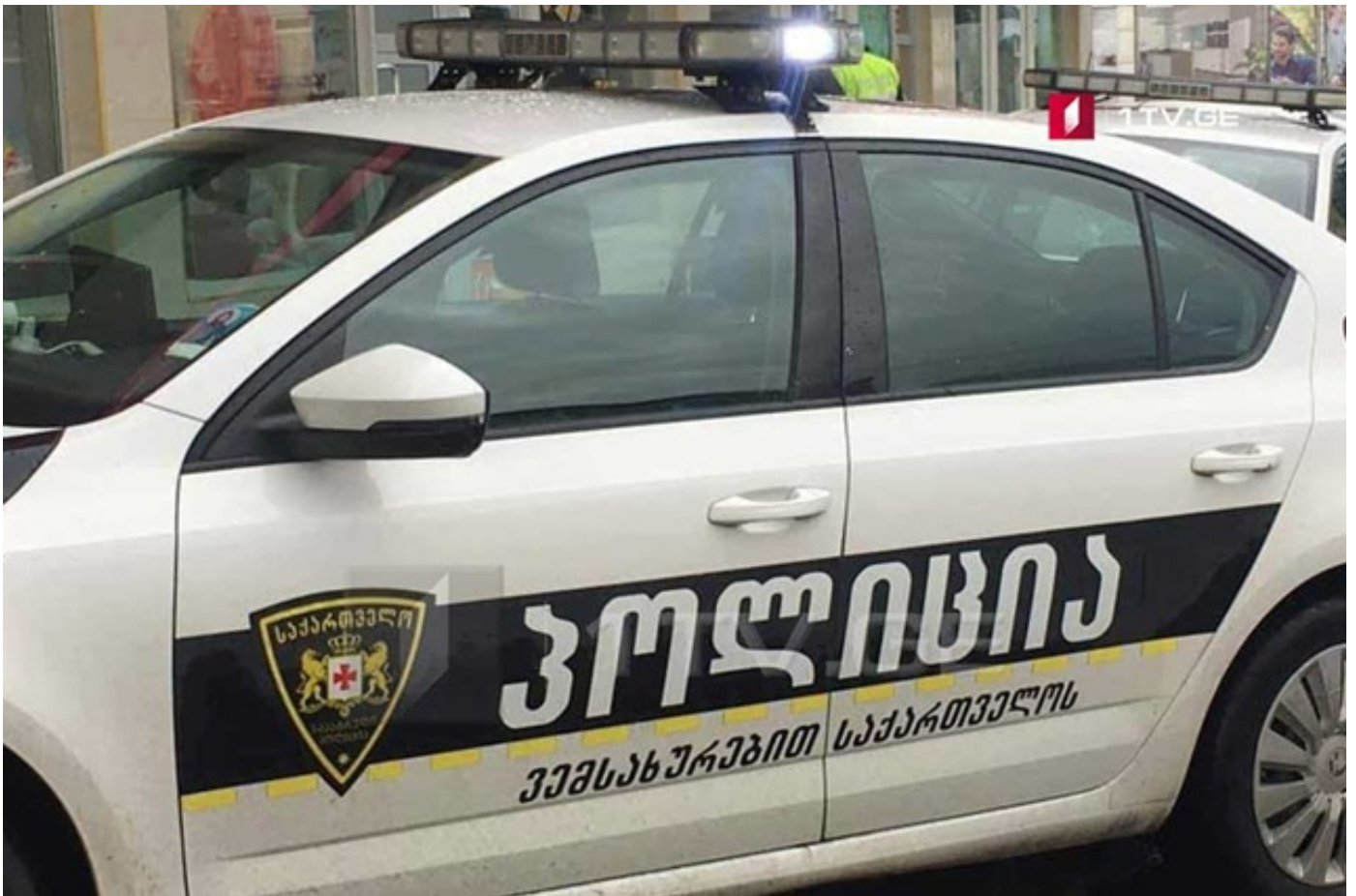
პოლიციამ საგანგებო მდგომარეობის რეჟიმის დარღვევის 93 ახალი ფაქტი გამოავლინა