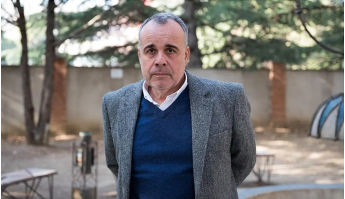
„მენაშენეთა ასოციაციის“ თავმჯდომარე - დევლოპერული სექტორის მხარდაჭერით მთავრობა ადგილობრივ წარმოებასაც დაეხმარება