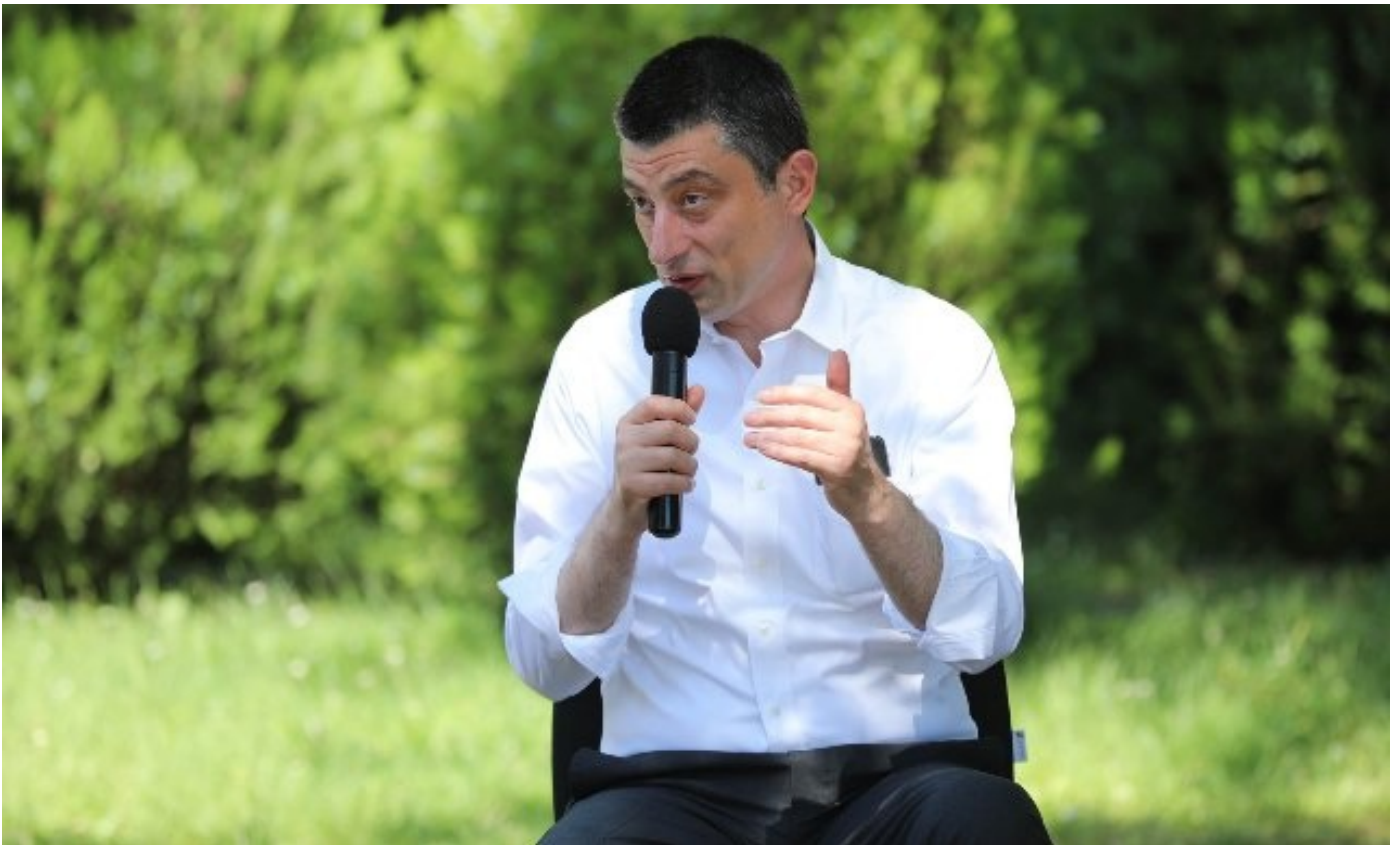
გიორგი გახარია - პასუხისმგებლიანი ხელისუფლების ამოცანაა, რესურსი, რომელიც აქვს პატარა ქვეყანას, მაქსიმალურად სამართლიანად გადაუნაწილოს ყველას, ვისაც სჭირდება