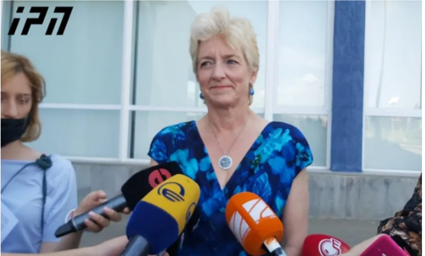
ლუიზა ვინტონი - საქართველოს რეაგირება ახალი კორონავირუსის პანდემიასთან იყო სანიმუშო და ამას მთელი მსოფლიო აღიარებს