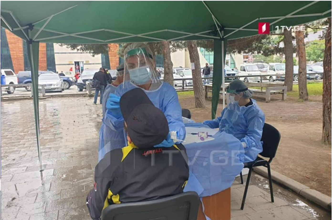
მესტიის ცენტრში მოწყობილ საველე კარავში ეპიდემიოლოგები კორონავირუსზე მოსახლეობას იკვლევენ