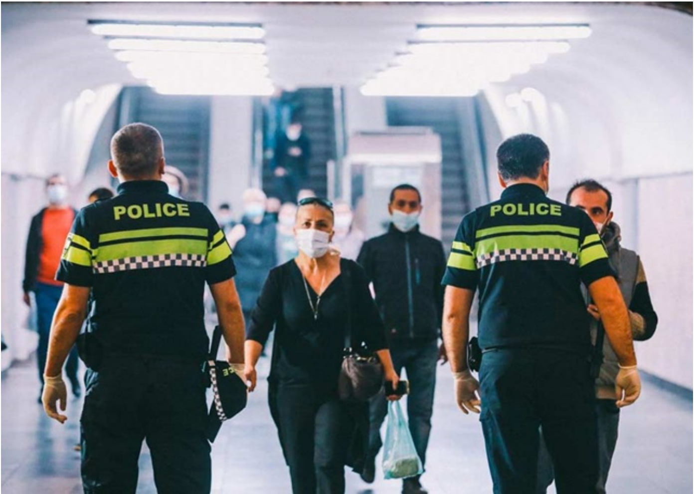
პოლიცია „კოვიდ-19“-თან დაკავშირებით რეკომენდაციების აღსრულების მიზნით, მეტროსადგურებთან მონიტორინგს აგრძელებს