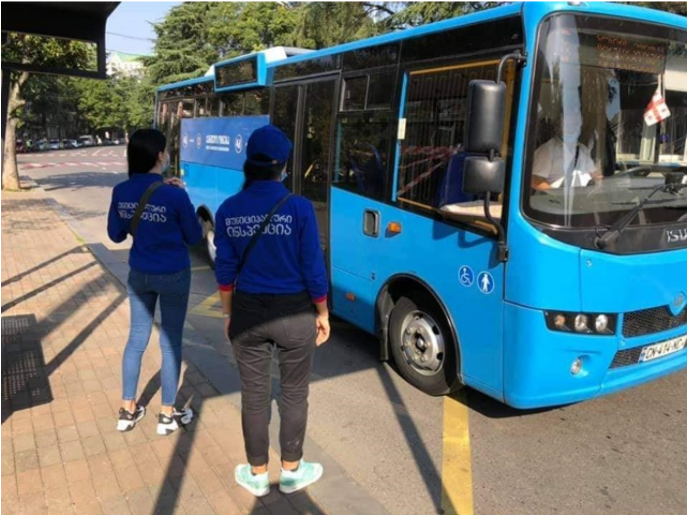
ბათუმის მუნიციპალური ინსპექცია საზოგადოებრივ ტრანსპორტში მონიტორინგს აგრძელებს