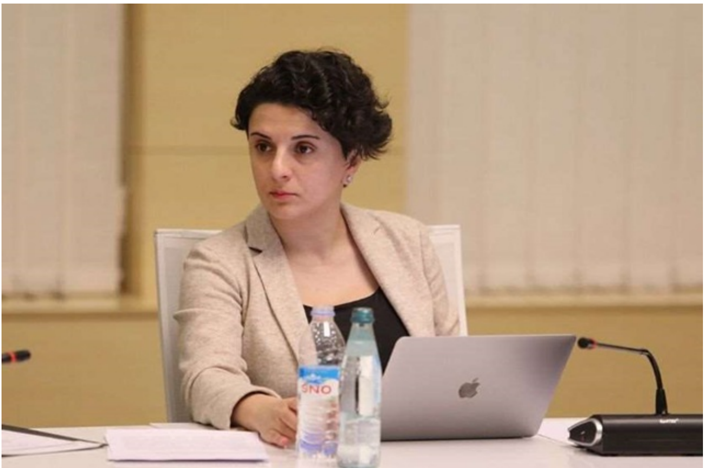
ნათია მუზვრიშვილი: წერტილოვანი და ლოკალური შეზღუდვები გვაძლევს შესაძლებლობას, სიტუაცია ეკონომიკისთვის მძიმე ზიანის გარეშე ვმართოთ