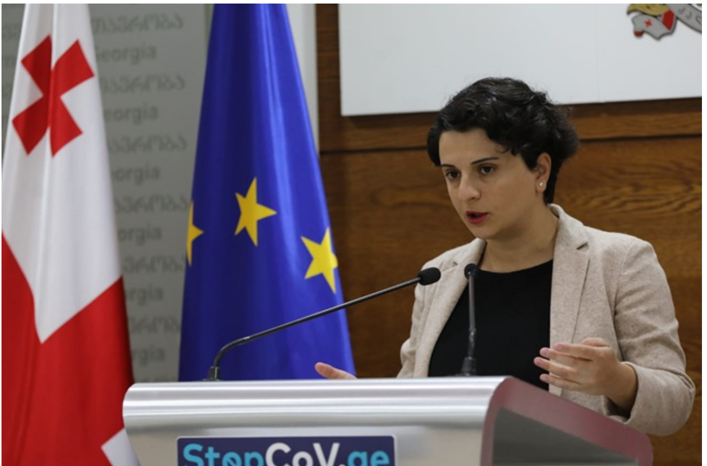
ნათია მუზვრიშვილის თქმით, ამ ეტაპზე მთავრობა სასწავლო დაწესებულებებში კორონავირუსის მასშტაბური გავრცელების რისკებს ვერ ხედავს