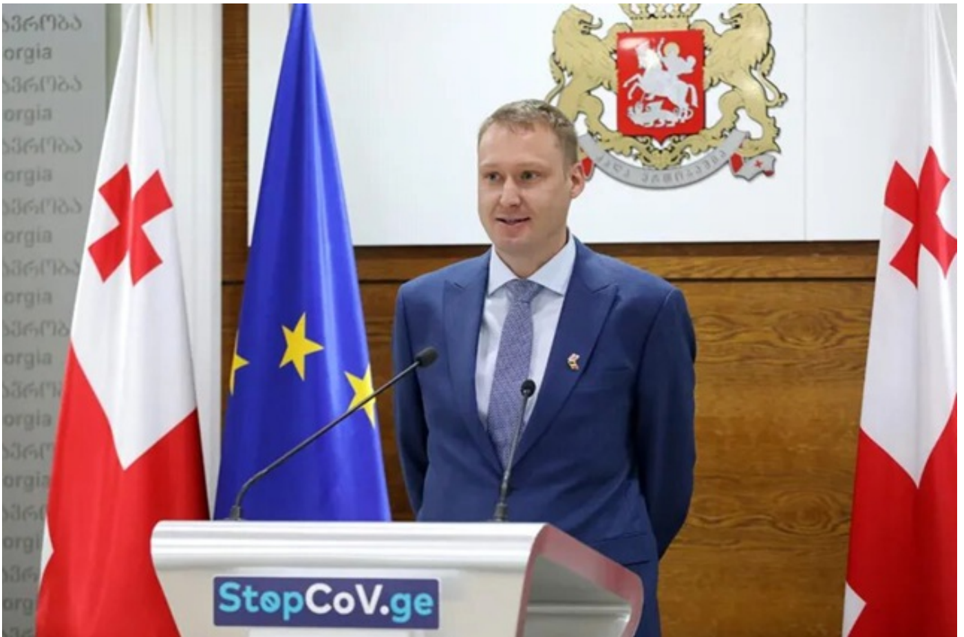
ევროპული ბიზნესასოციაციის თავმჯდომარე - ჩვენთვის მნიშვნელოვანია ჯეროვანი კომუნიკაცია მთავრობასთან, რათა პოსტპანდემური გეგმაც დავსახოთ