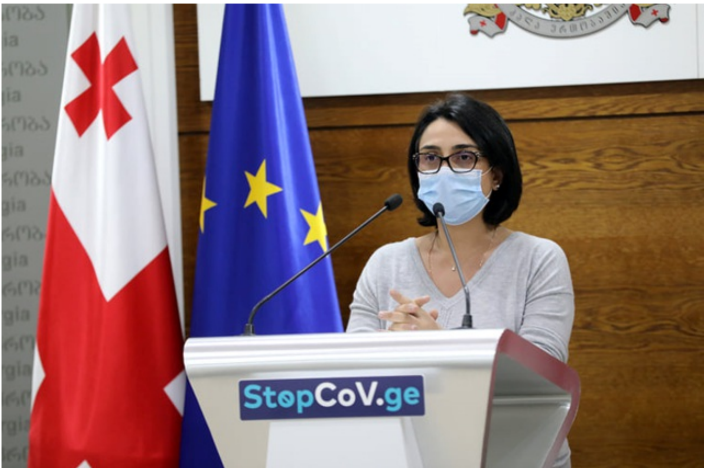
სასურსათო ქსელური მაღაზიების ასოციაციის თავმჯდომარე - ეპიდემიოლოგიური სიტუაციის გაუარესებიდან გამომდინარე, ვითხოვთ, იქნებ საშემოსავლო შეღავათი კიდეც ექვსი თვით გაგრძელდეს