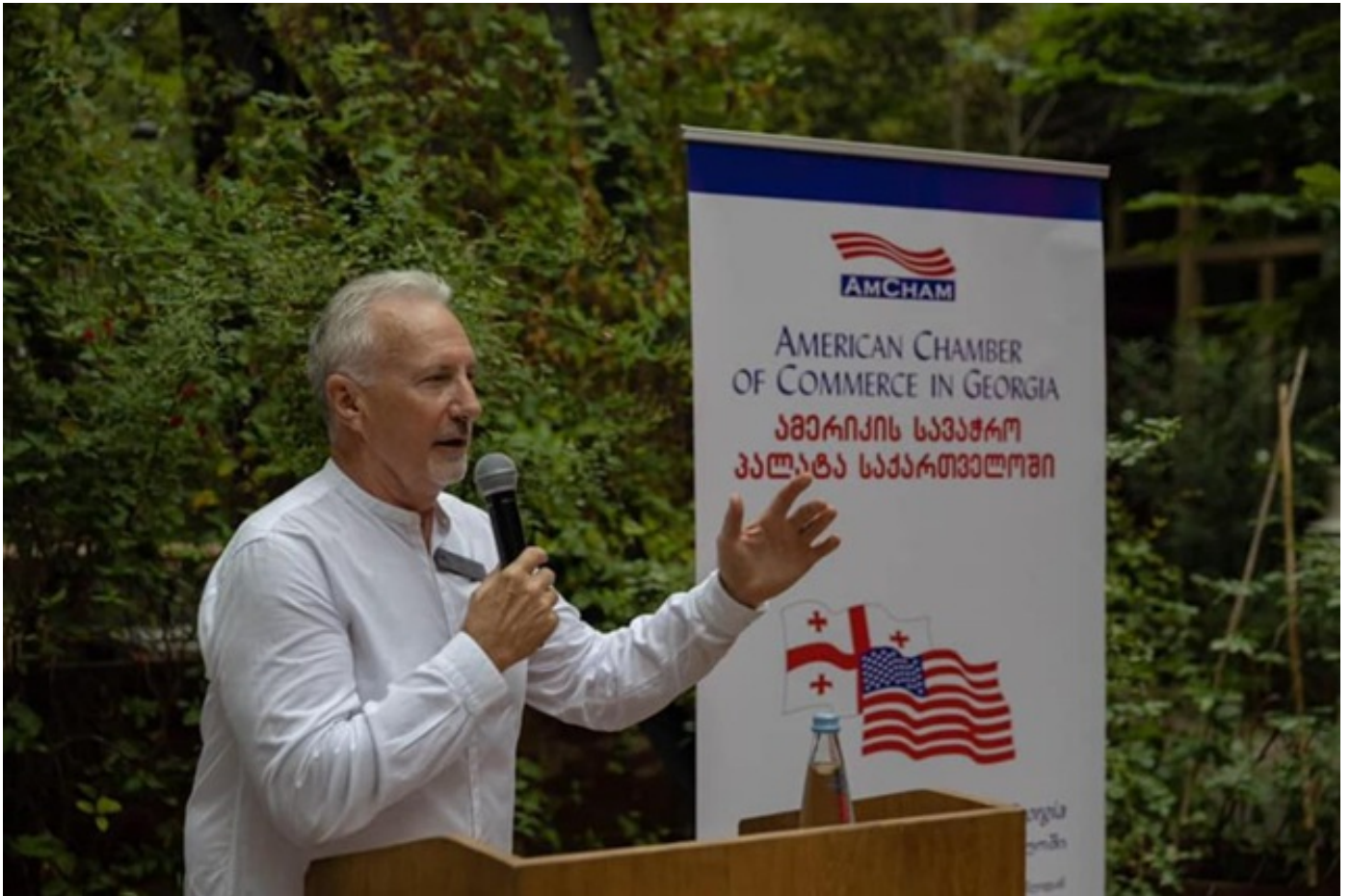
ამერიკის სავაჭრო-სამრეწველო პალატის პრეზიდენტი - პრემიერთან შეხვედრაზე ჩემს ყველა კითხვას პასუხი გაეცა