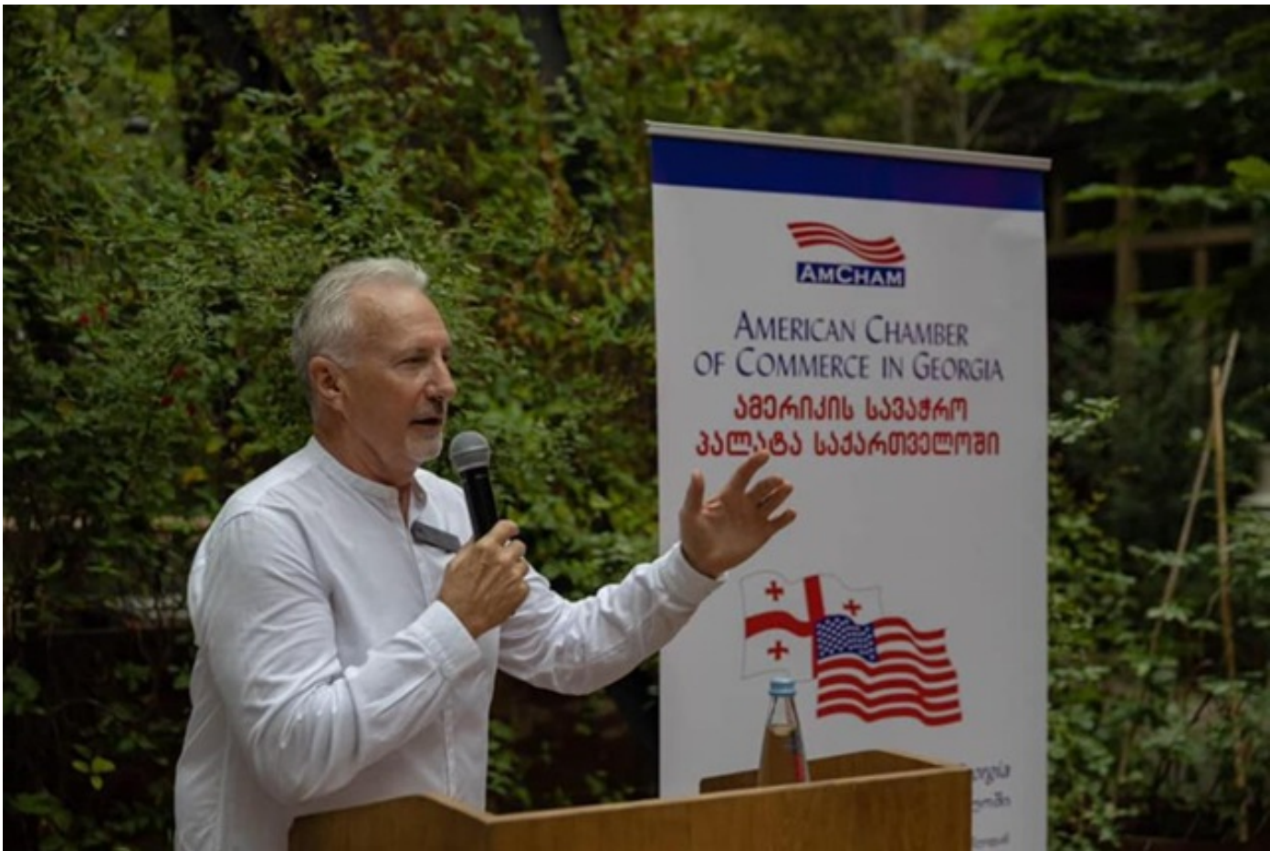
ამერიკის სავაჭრო-სამრეწველო პალატის პრეზიდენტი - პრემიერთან შეხვედრაზე ჩემს ყველა კითხვას პასუხი გაეცა