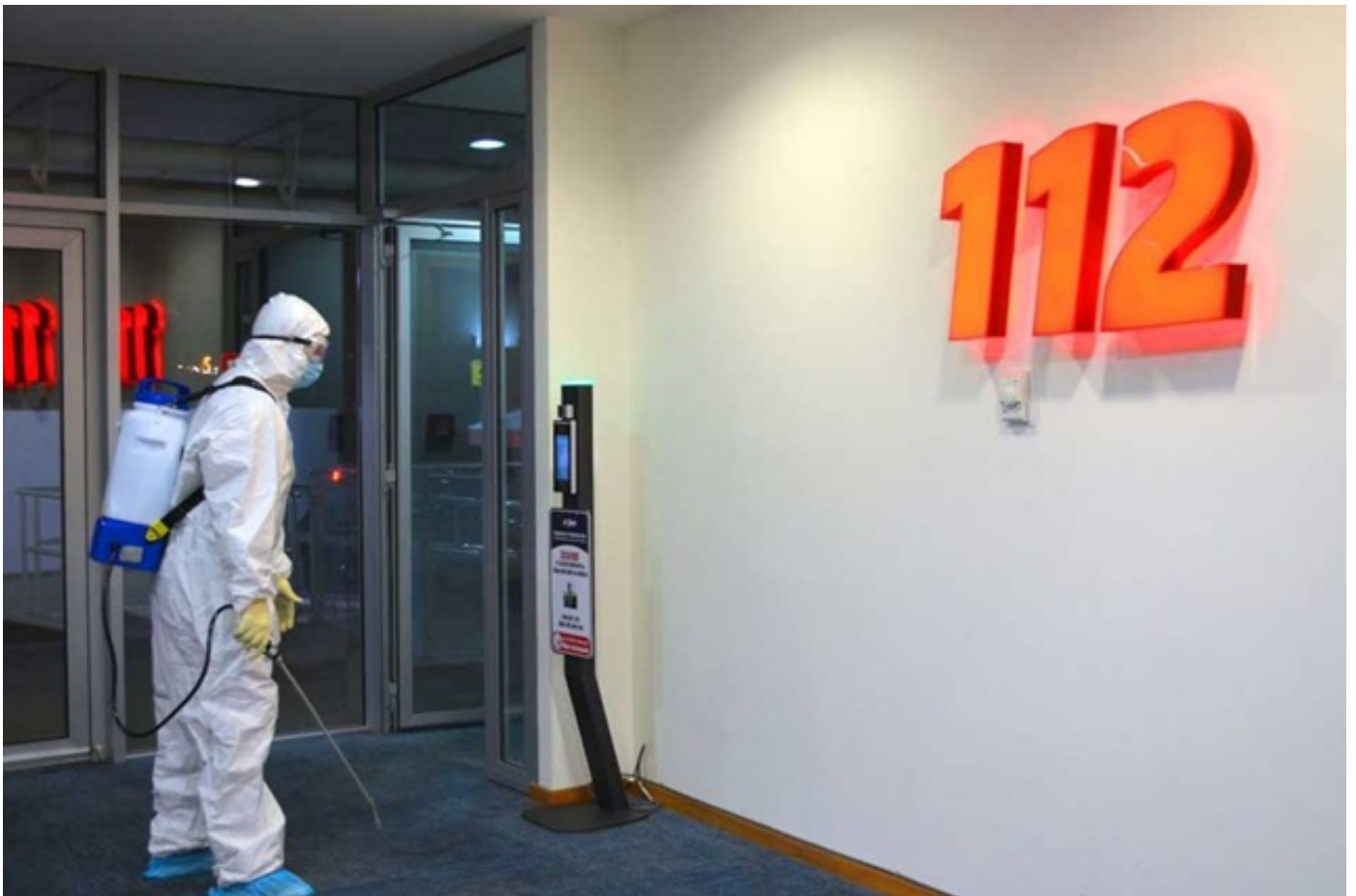
შსს-ს საზოგადოებრივი უსაფრთხოების მართვის ცენტრ 112-ში სადებიინფექციო სამუშაოები ჩატარდა