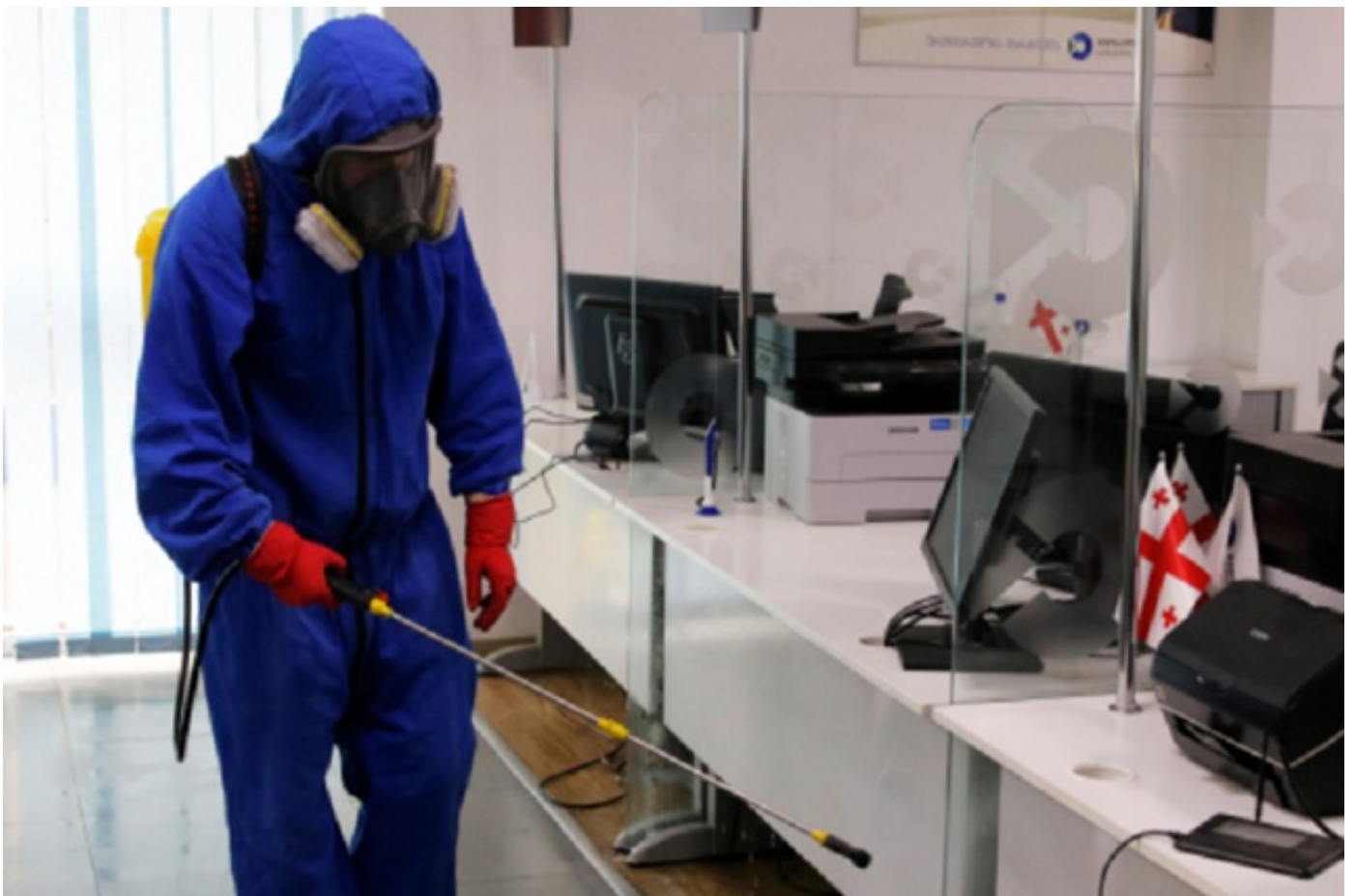
შემოსავლების სამსახურის მოქალაქეთა მომსახურების ცენტრებში სადებიინფექციო სამუშაოები გრძელდება