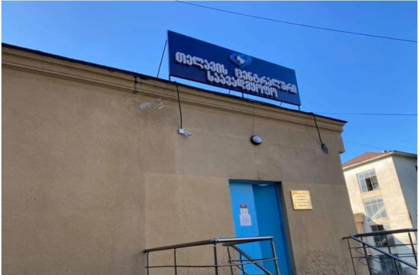
ხვალდან კახეთში მეორე კოვიდკლინიკა დაიწყებს მუშაობს

"მსოფლიოში ეპიდემიოლოგიური ვითარება კიდევ უფრო უარესდება. სხვადასხვა ქვეყნებში COVID-19-ის გავრცელების უპრეცედენტოდ მაღალი შემთხვევები ფიქსირდება" #მსოფლიო #კორონავირუსი