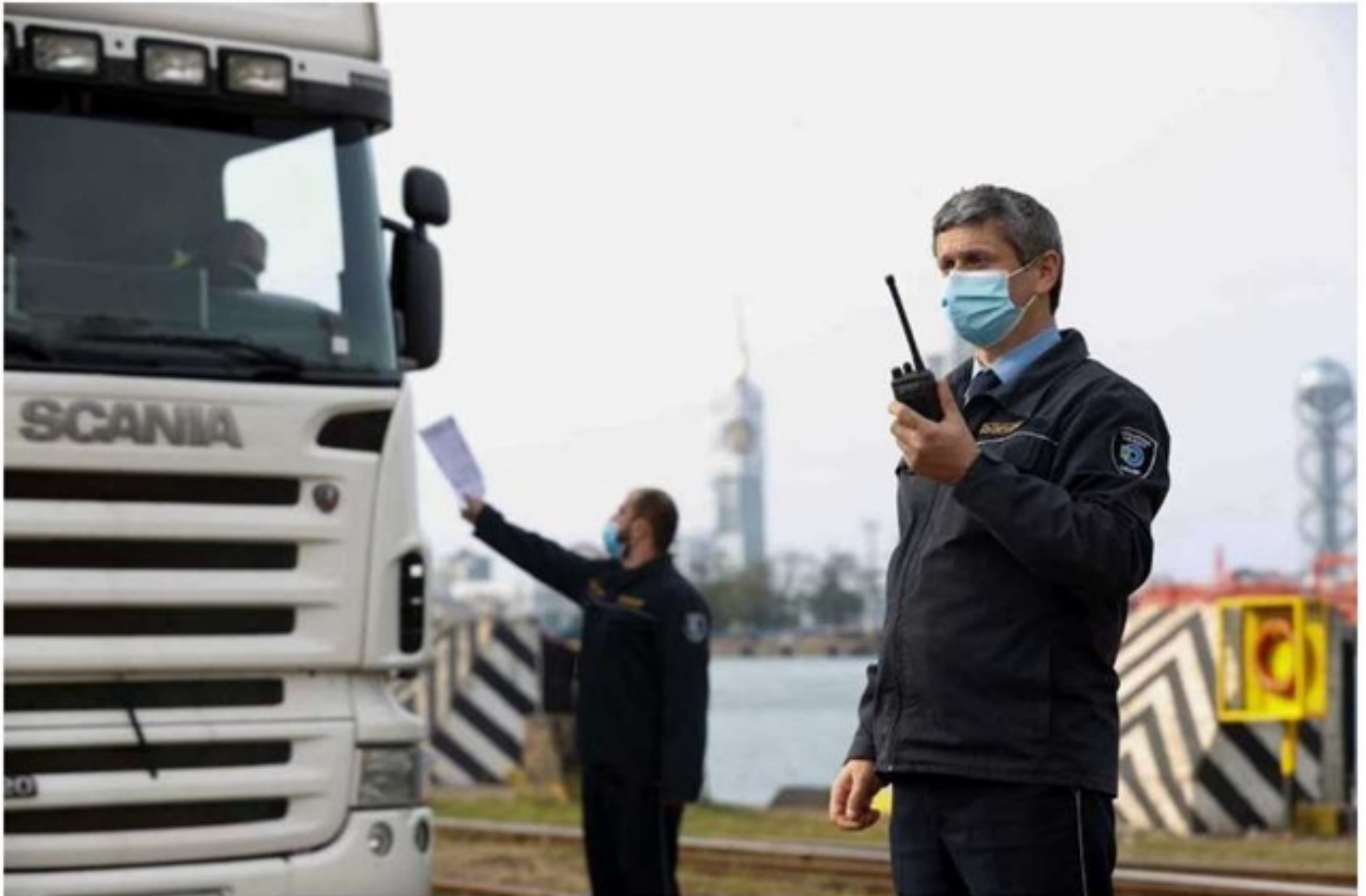
გლობალური კრიზისისა და COVID-19 პანდემიის პირობებში, საქართველო საერთაშორისო საზღვაო გადაზიდვებს სხვადასხვა ქვეყნის მიმართულებით შეუფერხებლად ახორციელებს