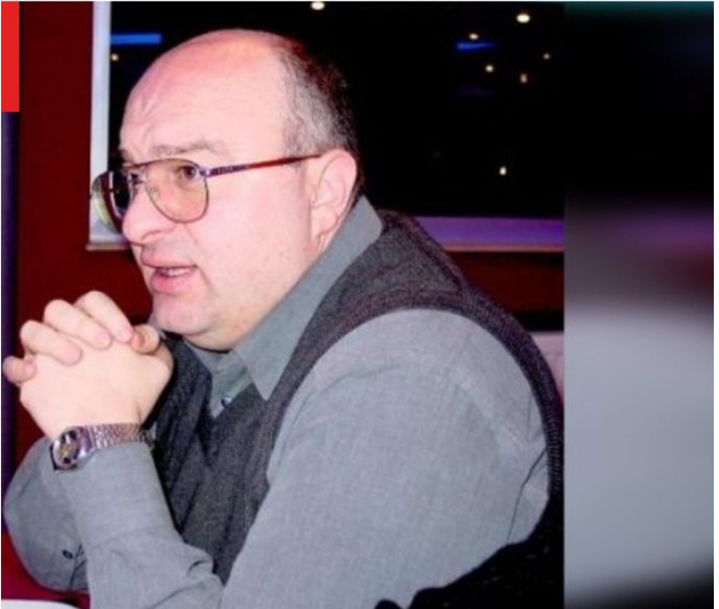
ჩვენ ერს ბევრად უფრო მძიმე განსაცდელისთვის გაუძლია, თუმცა, ჩემი ცხოვრების 60 წლის მანძილზე ასეთი რამ ჯერ არ ყოფილა, ამ პანდემიას არც 90-იანების ომი და გასაჭირი შეედრება