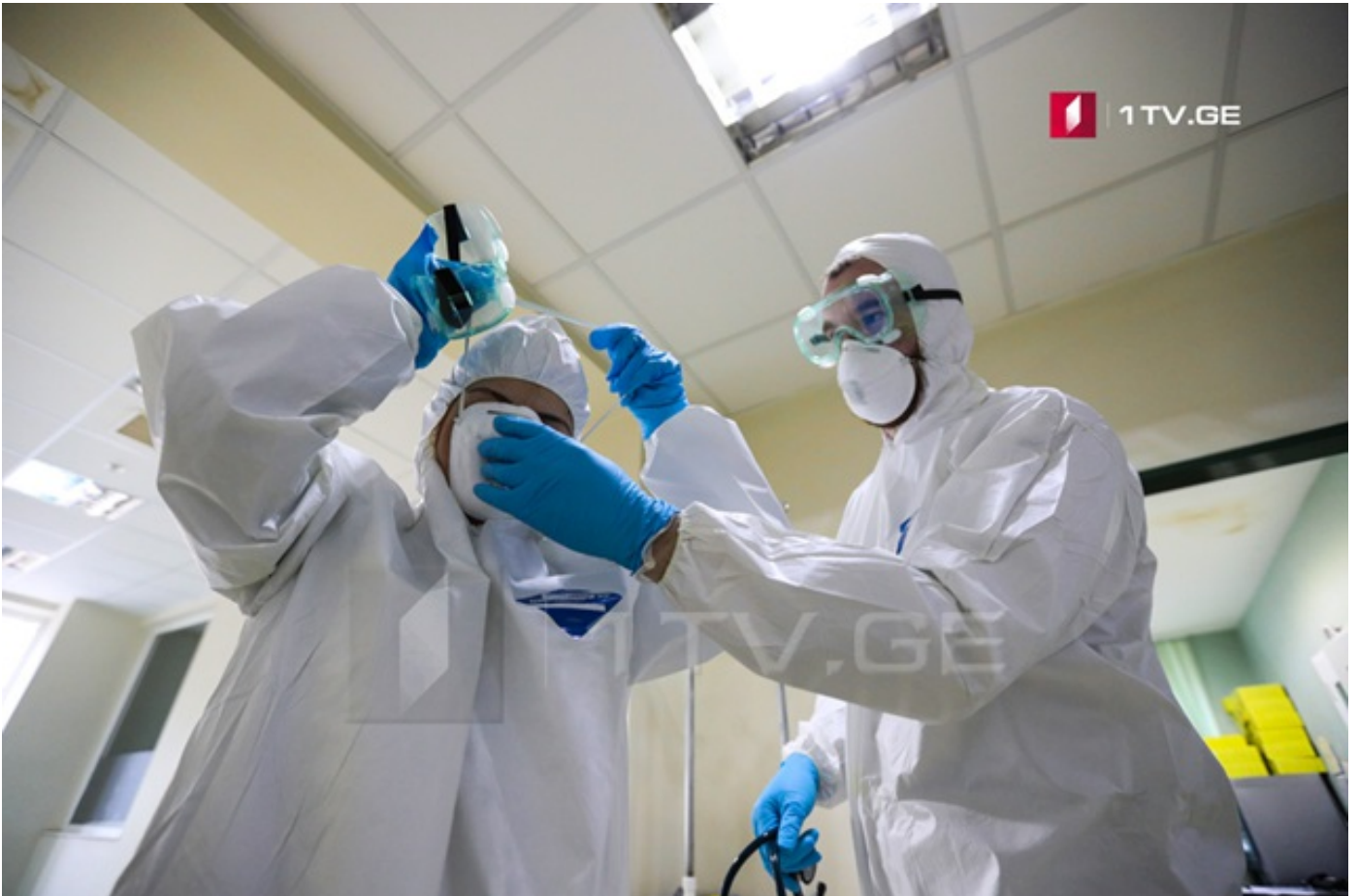
Коронавирусы ног цаутәй Тбилисы 1784 рабәрәг ис, Аджарийы 683, Имереты 662