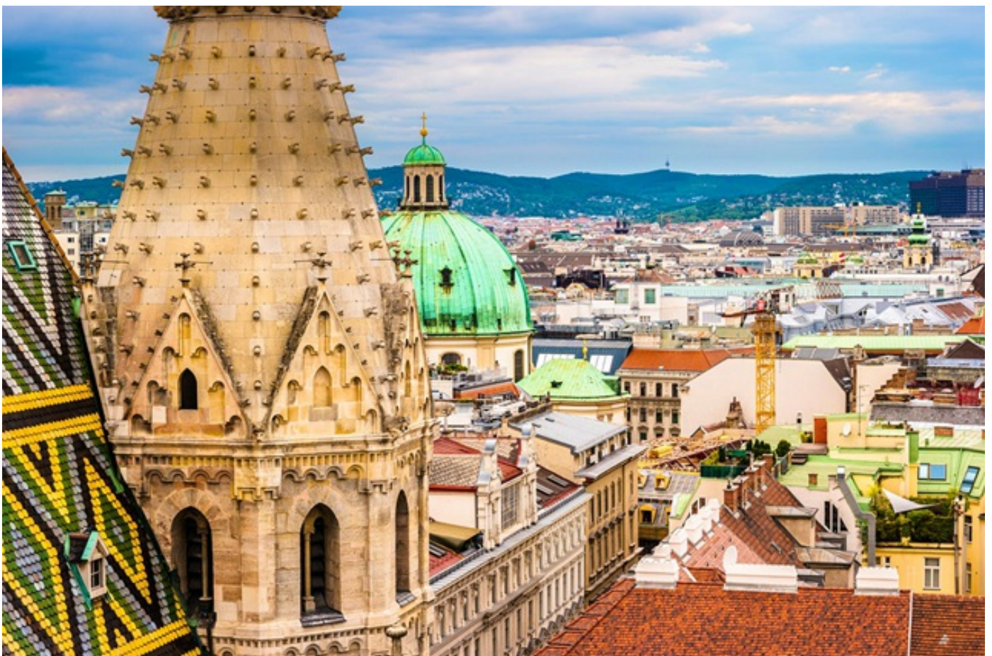
ავსტრიაში მკაცრი, საყოველთაო კარანტინი გამოცხადდა