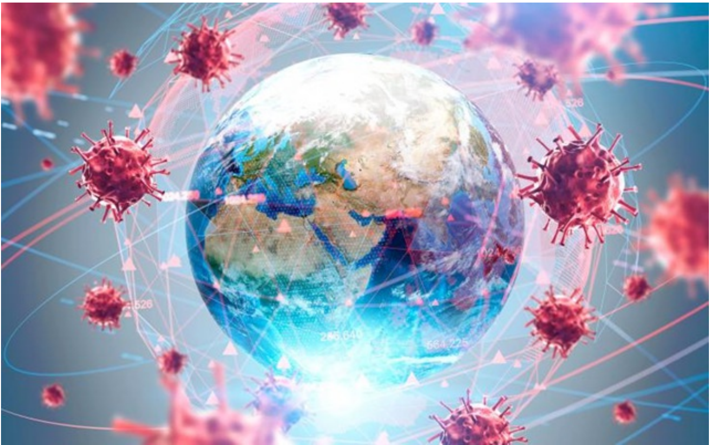
COVID-19-ის გავრცელების შეკავების მიზნით ევროპასა და რეგიონში მკაცრი შეზღუდვები დაწესდა