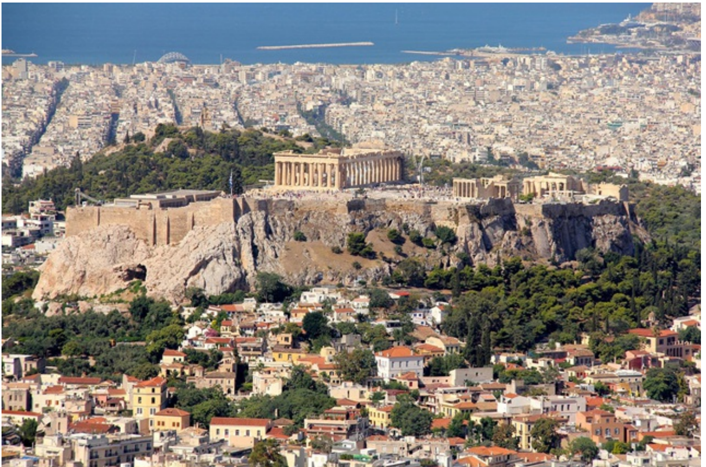
მსოფლიო საბერძნეთში ერთ-ერთიანი მკაცრი, საყოველთაო კარანტინი მოქმედებს – პირბადის ტარების წესის დარღვევისთვის ჯარიმა 300 ევრომდე გაიზარდა