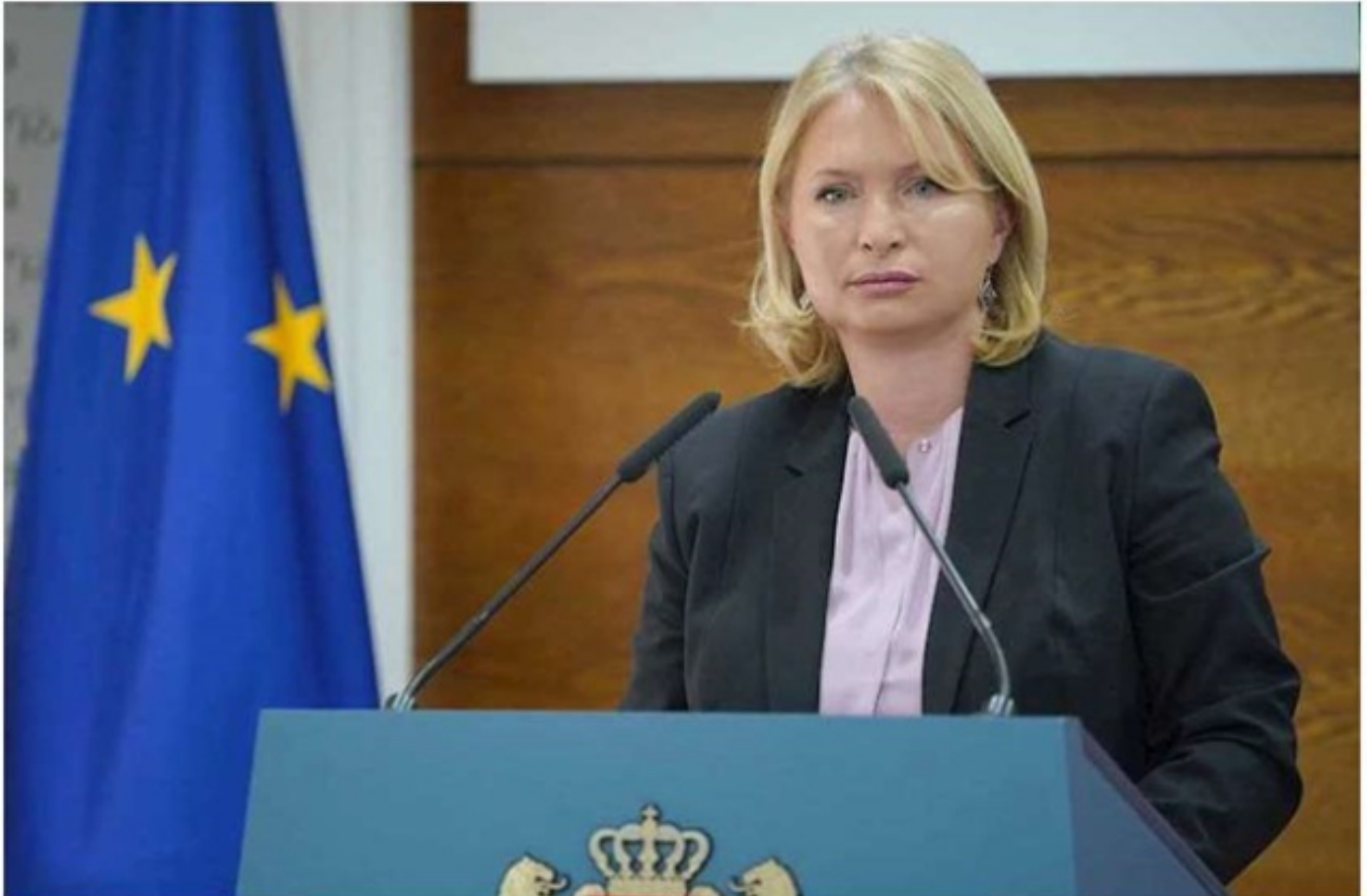
ნათია თურნავა: სამედიცინო ჟანგბადის გაზრდილი მოთხოვნის 90 პროცენტს უკვე ადგილობრივი წარმოების ჟანგბადი ფარავს

საქართველოს პრემიერ-მინისტრმა გიორგი გახარიამ Covid-19-ის მართვაში ჩართული კერძო