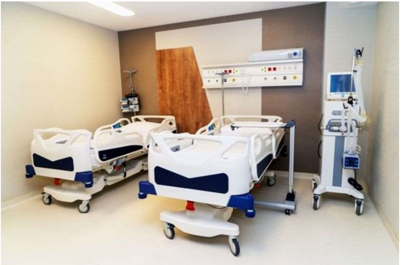
იმერეთში არსებულ კოვიდცენტრებში სანოლების რაოდენობა 55-ით გაიზარდება