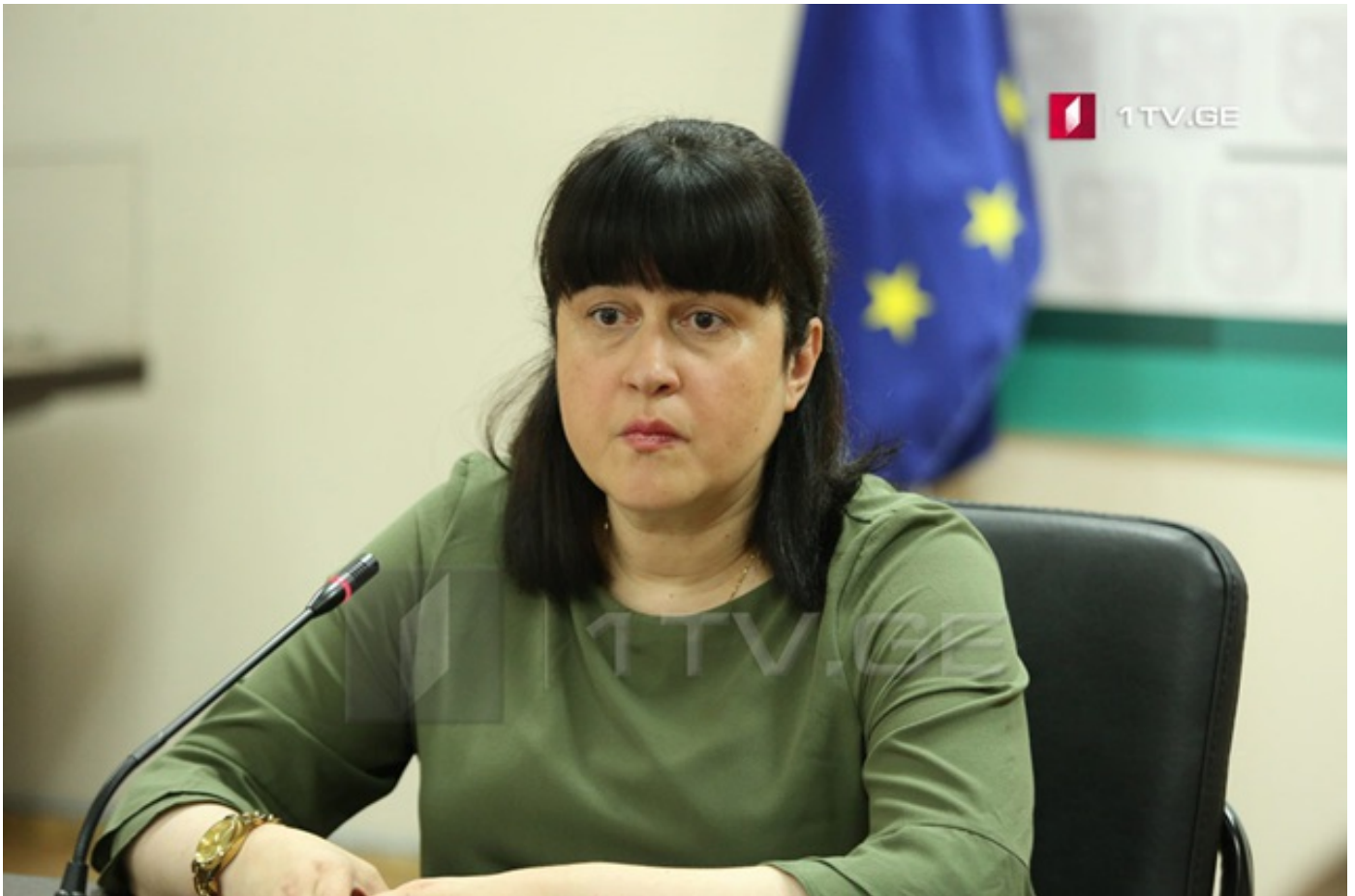
თამარ გაბუნია - ეპიდსიტუაციის სტაბილიზაციის გარკვეული ნიშნები აღინიშნება, განსაკუთრებით აჭარის რეგიონში