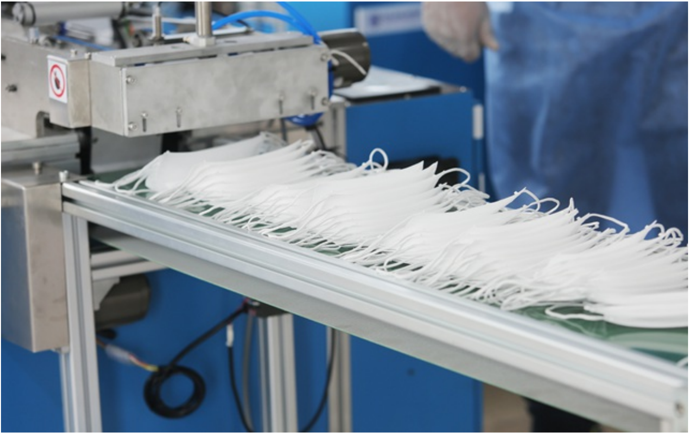
პანდემიის პირობებში, საქართველომ 5.4 მილიონი პირბადე აწარმოა