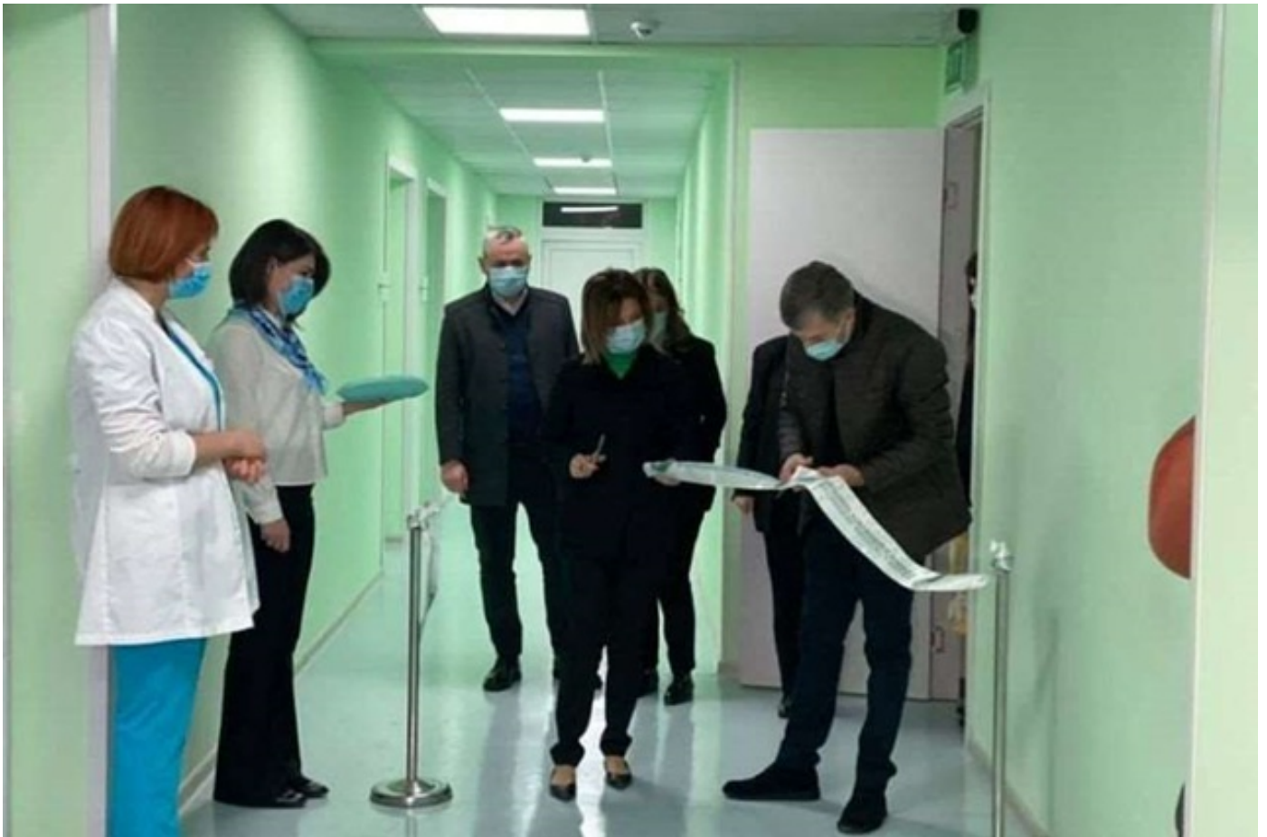
საჩხერის სამედიცინო ცენტრში ინფექციური განყოფილება და სისხლის ბანკი გაიხსნა

✓ 2020 წელს სახელმწიფო პროგრამის „აწარმოე საქართველოში“ ფარგლებში დაფინანსდა 78 ახალი პროექტი, დამტკიცებული სესხების