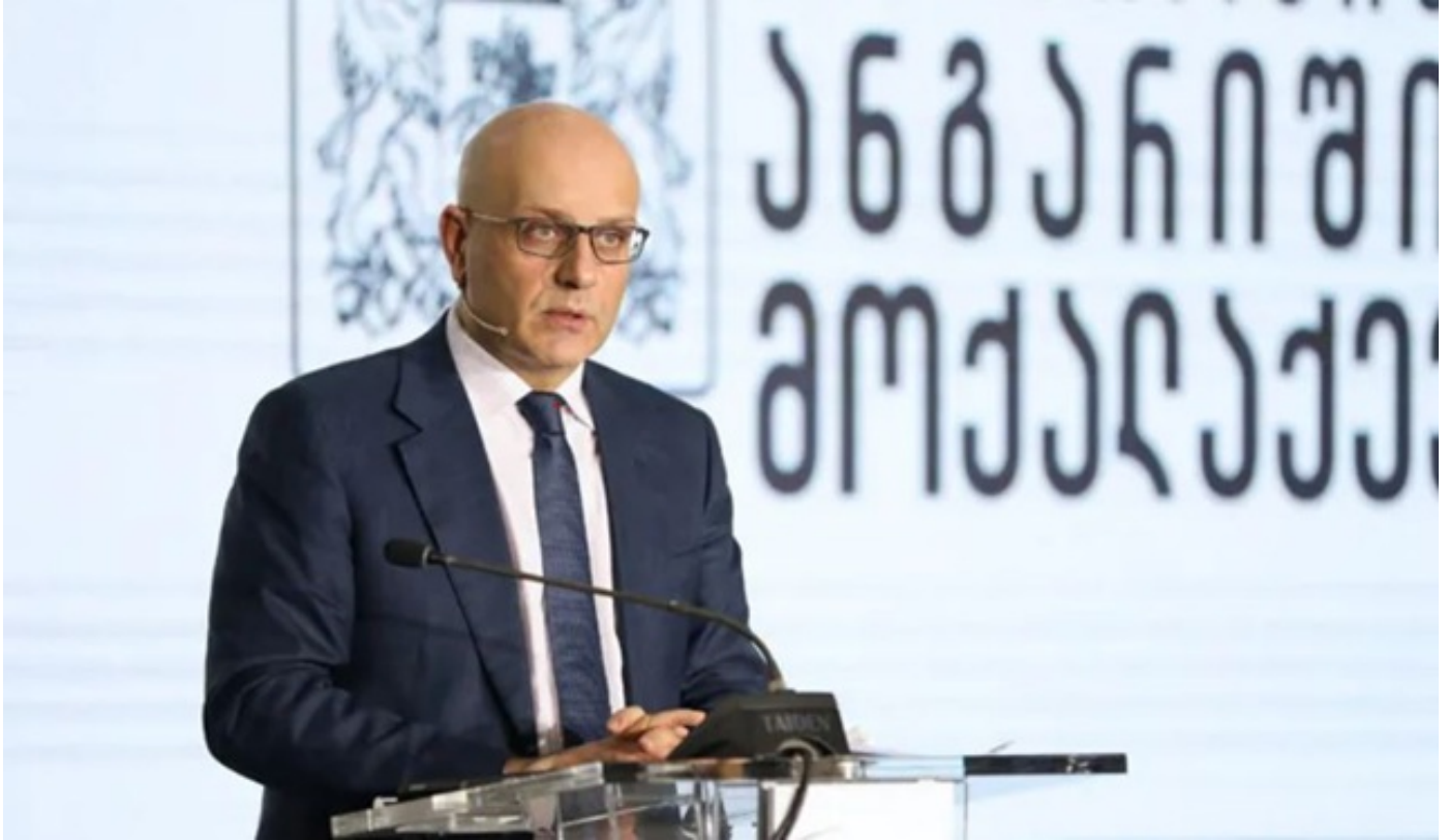
ივანე მაჭავარიანმა მომდევნო წლებში გამოწვევების საპასუხოდ მიმართულ ნაბიჯებზე ისაუბრა