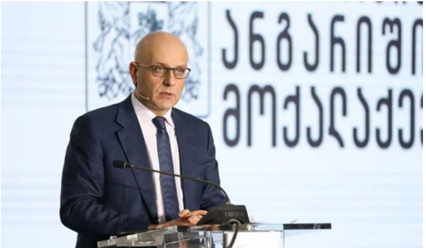
ივანე მაჭავარიანმა მომდევნო წლებში გამოწვევების საპასუხოდ მიმართულ ნაბიჯებზე ისაუბრა