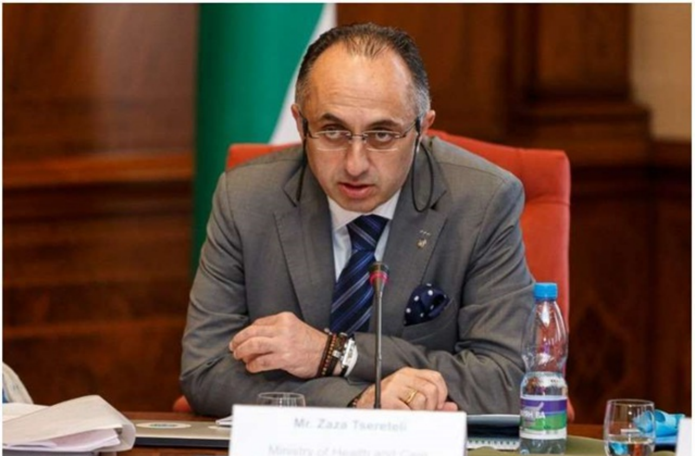
ზაზა წერეთელი: თუ ახალ წელს ერთმანეთთან მისვლა-მოსვლას არ მოვერიდებით, შეიძლება კატასტროფული შედეგი დადგეს

გიორგი გახარია - მსოფლიო ველარ იქნება ისეთი, როგორც იყო პანდემიამდე და ჩვენი ამოცანაა, შევძლოთ პატარა უპირატესობა მოვუპოვოთ ქვეყანას, როგორც მიაღწიოს მეტ შედეგს