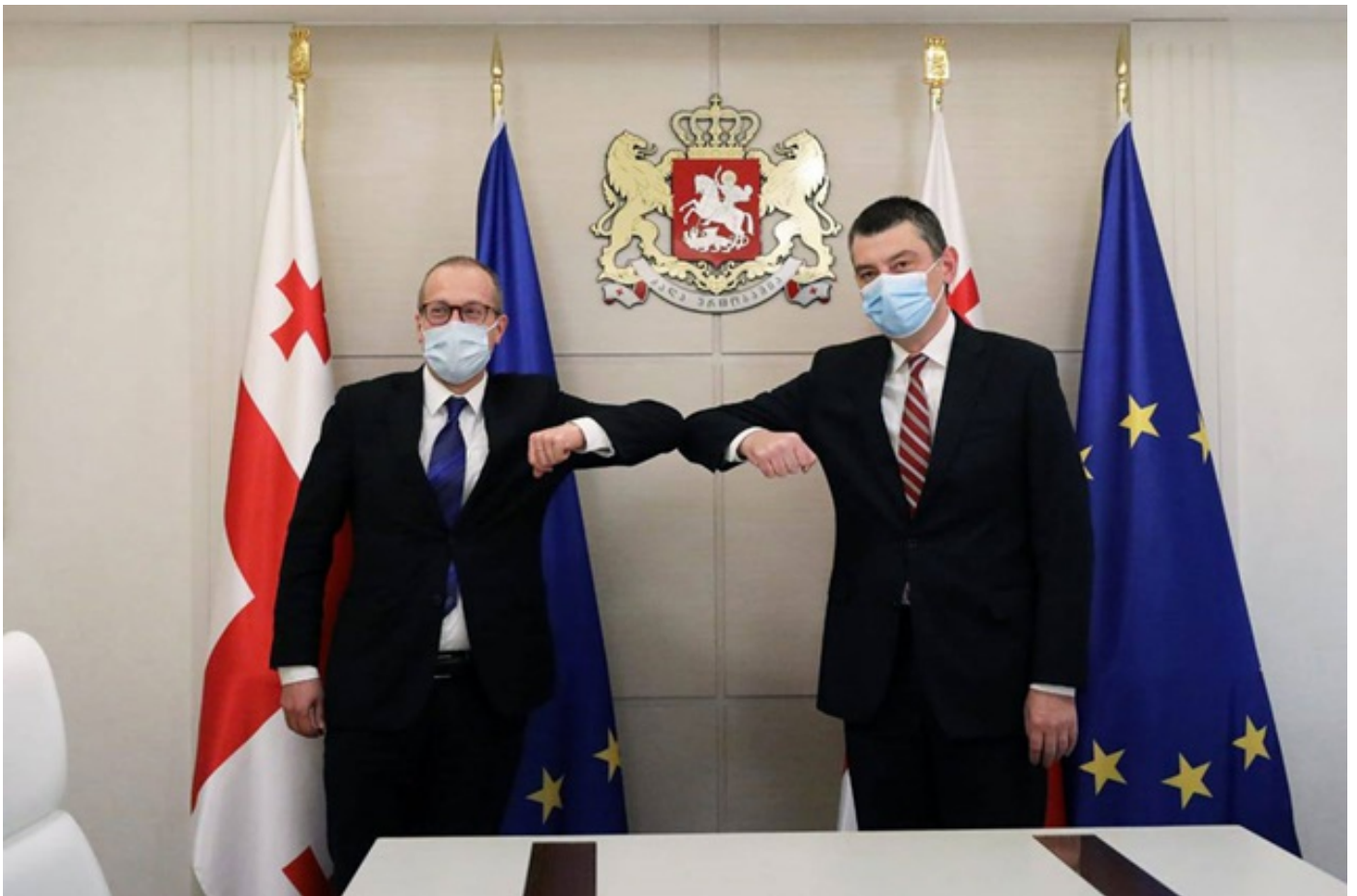
ჰანს კლუგე - საქართველოს მთავრობის რეაგირება პანდემიაზე უდავოდ სანაქებოა