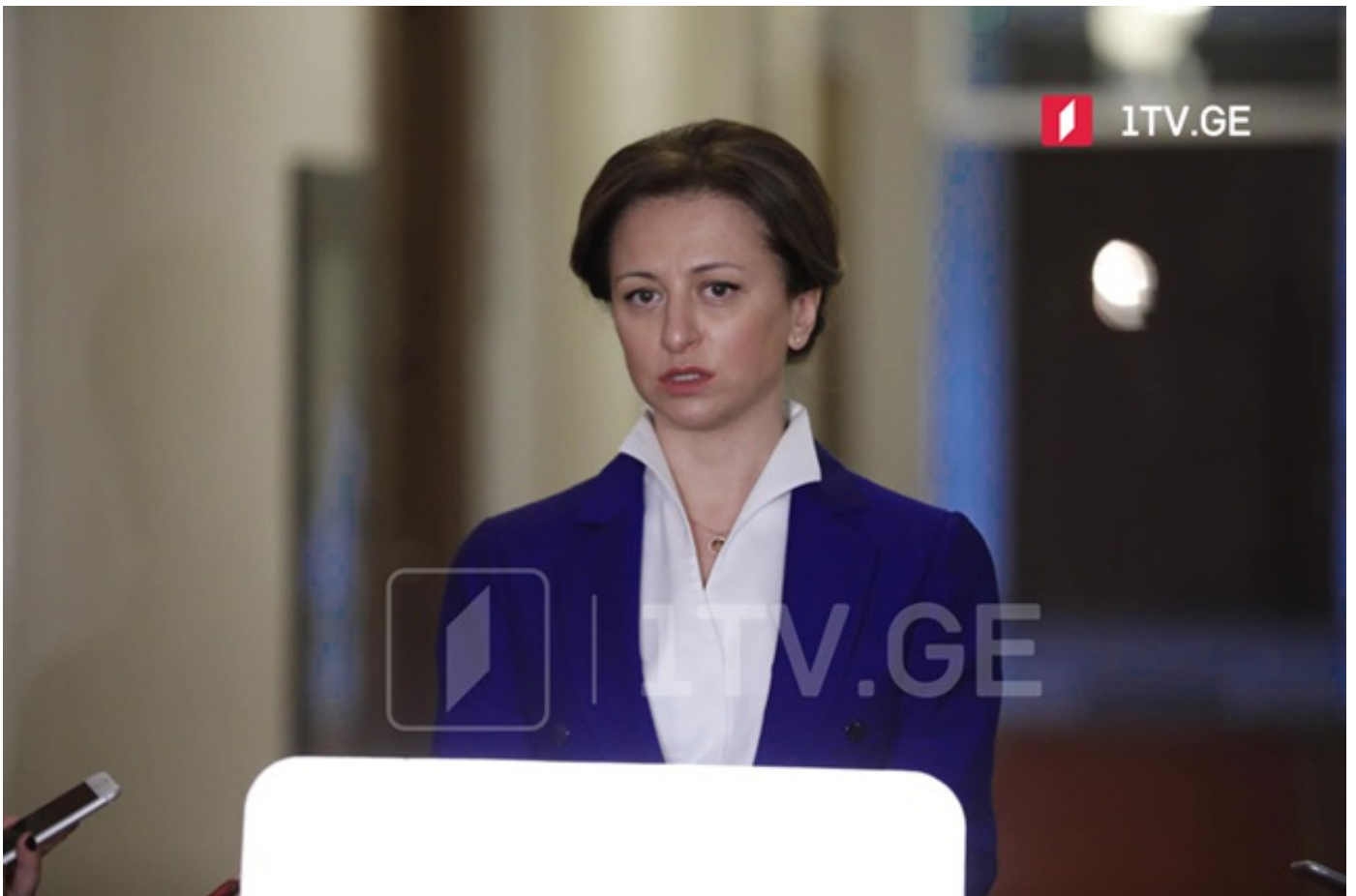
ეკატერინე ტიკარაძე - შებენიანების ნაწილობრივი მოხსნით ჩვენს ეკონომიკას შესაძლებლობა მივცით, რომ გავლენა იქონიოს მოქალაქეების ეკონომიკურ და ფინანსურ მდგრალობაზე