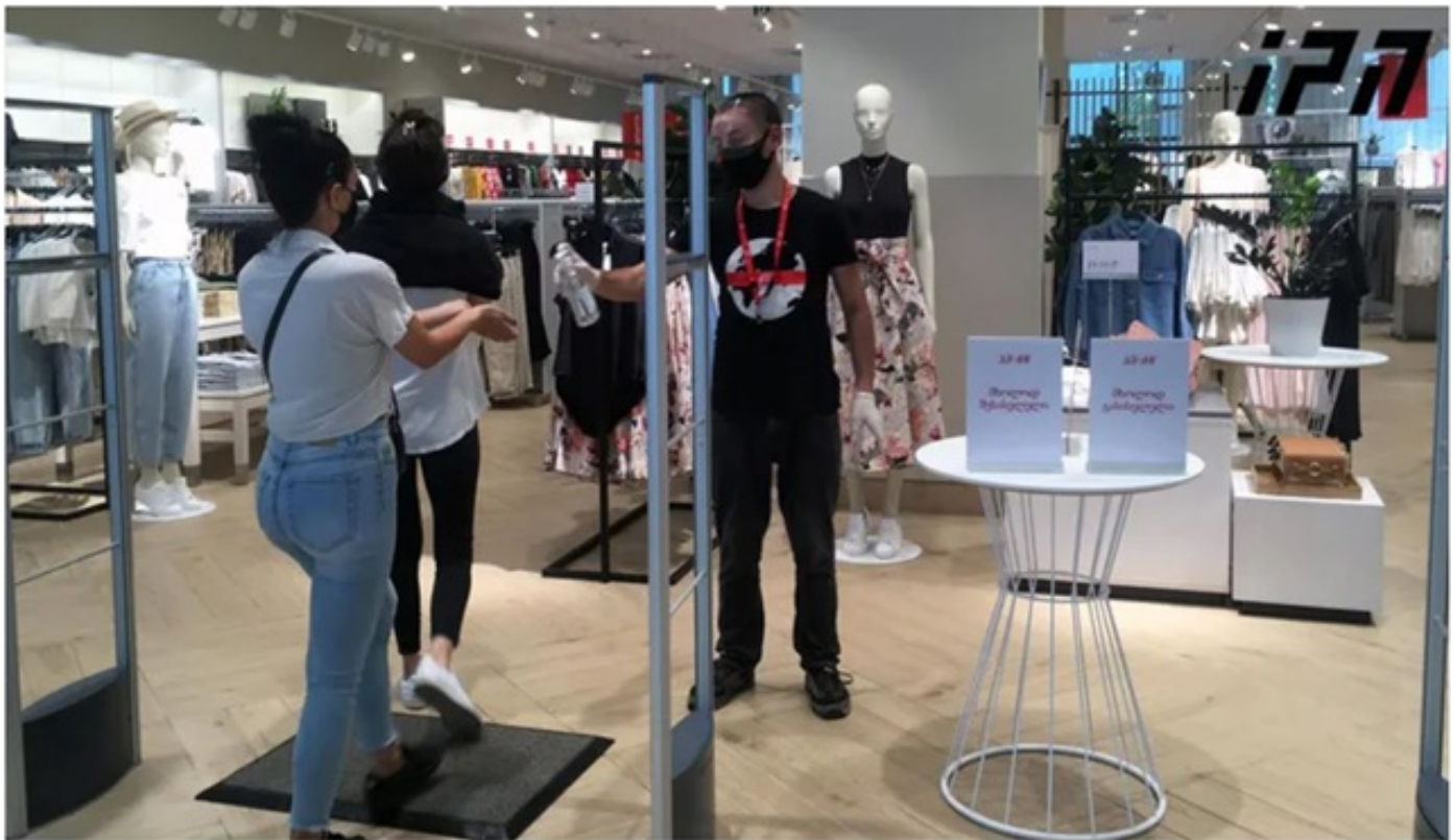
24 დეკემბრიდან 2 იანვრის ჩათვლით სავაჭრო ობიექტები მუშაობას განაახლებენ, მალაზიების სამუშაო საათები კი 07:00-დან 19:00 საათამდე განისაზღვრება