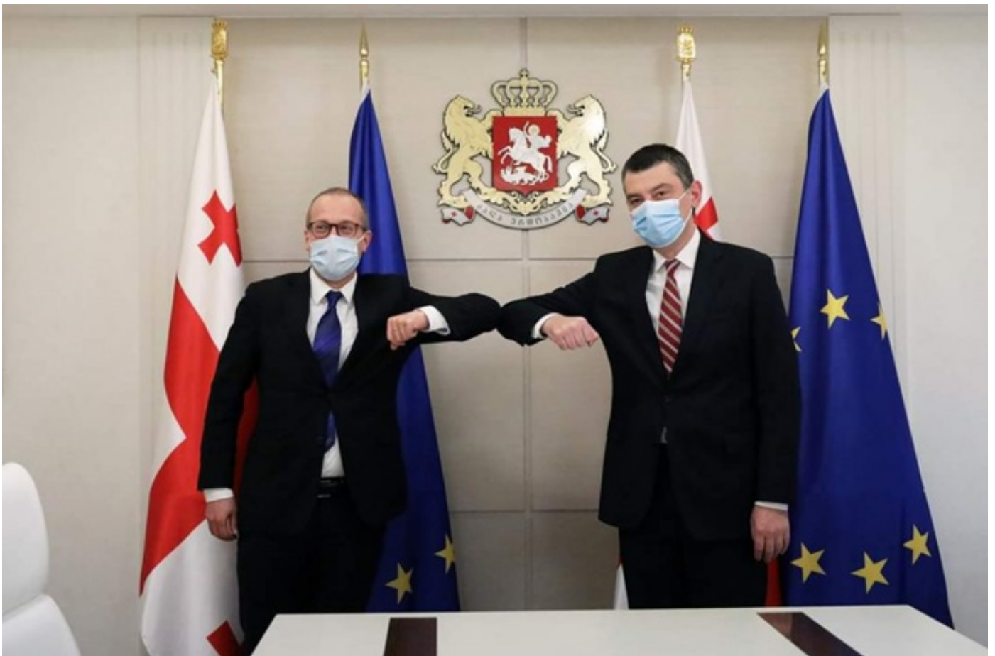
ჰანს კლუგე გიორგი გახარიას კორონავირუსის პანდემიაზე რეაგირებასა და საყოველთაო ჯანდაცვის რეფორმაში ლიდერობისთვის მადლობას უხდის