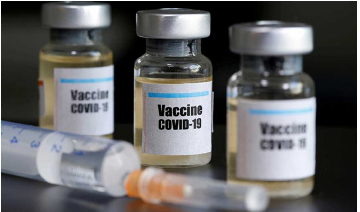
დიდი ბრიტანეთში „ასტრაზენეკას“ „კოვიდ-19“-ის საწინააღმდეგო ვაქცინალ გამოყენების ნებართვა გასცეს