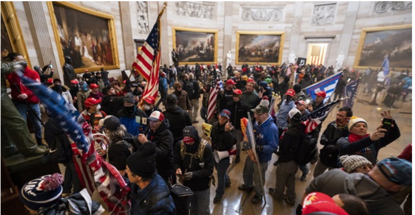
CDC ხელმძღვანელი აცხადებს, რომ აშშ-ში ჩატარებულმა აქციებმა შესაძლოა ეპიდეფთქება გამოიწვიოს

Travel platform in Big 7 Travel rating Georgia is second among countries where foreign citizens can work remotely