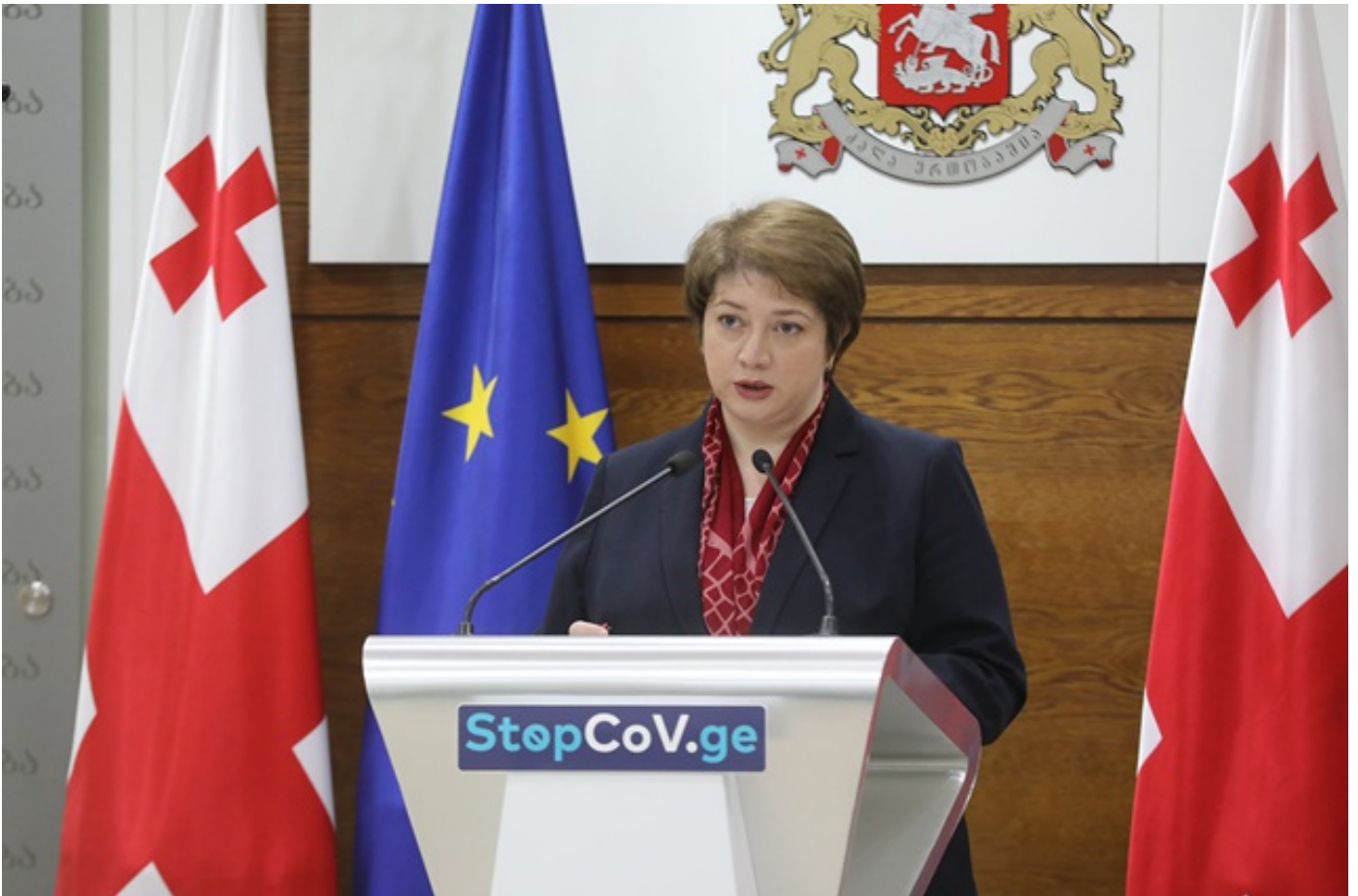
რატომ არ იხსნება ზამთრის კურორტები - მაია ცქიტიშვილი ბიზნესსექტორს პასუხობს